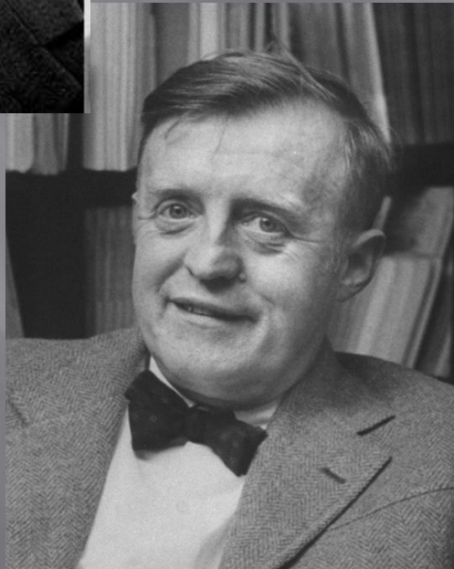
▣ Карл Иоахим Фридрих