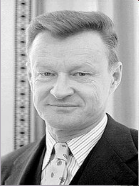
▣ Збигнев Бжезински