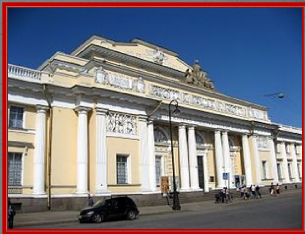
Российский этнографический музей