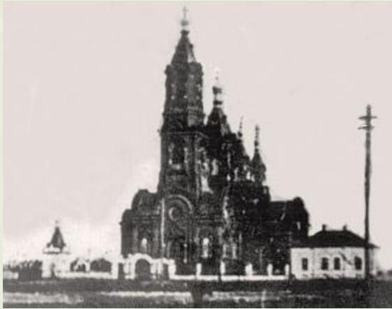
Старая Троицкая церковь

Во второй половине XVIII века в Балакове были построены три церкви, само село было государственным.