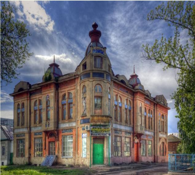
Торговый дом Шмидта