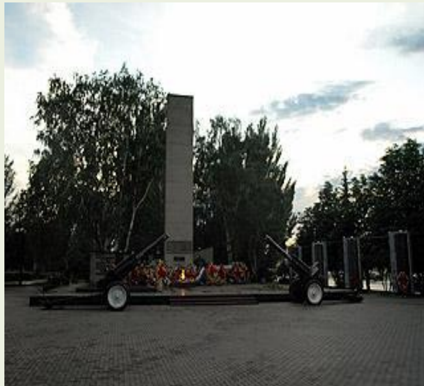
Мемориал Великой Отечественной войны

С началом Великой Отечественной войны на фронт ушли более десяти тысяч балаковцев, более половины из них погибли. Посевные и уборочные работы, а также труд у заводских станков легли на плечи балаковских женщин, стариков и детей.