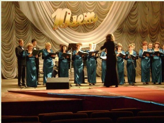
Камерный хор "Откровение"