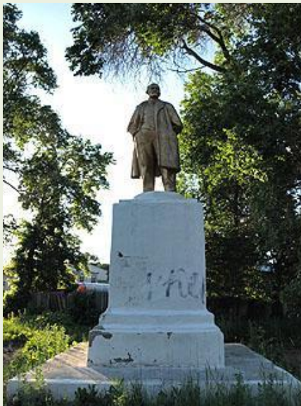
Старый памятник В. И. Ленину