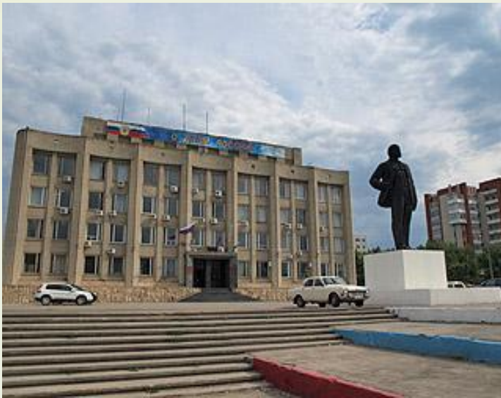
Администрация города и памятник В. И. Ленину