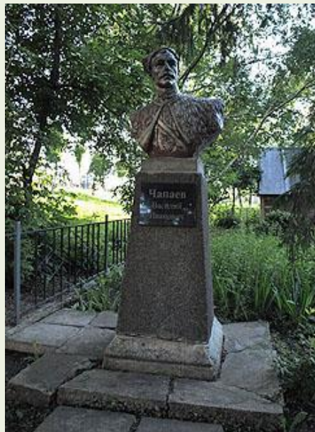
Бюст В. И. Чапаева

Все балаковские памятники были открыты в советскую и послесоветскую эпоху.