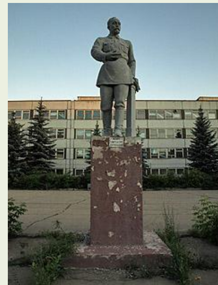
Памятник Ф. Э. Дзержинскому