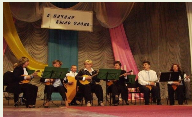
Ансамбль народных инструментов "Наигрыш"