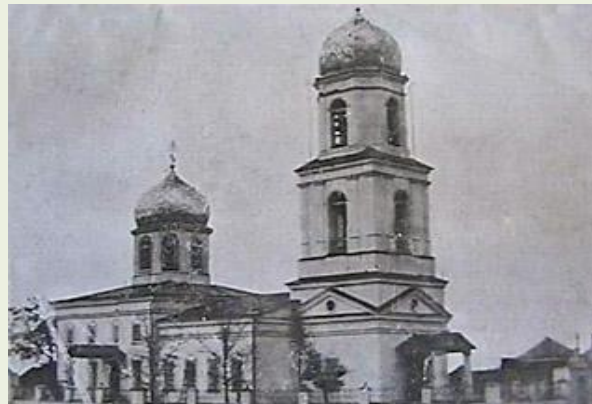
Храм Рождества Христового