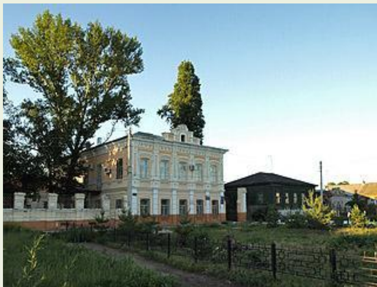
Улица в старой части города