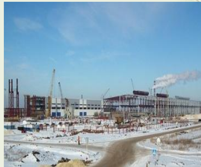
Сортовой завод в Балаково

Сортовой завод в Балаково – это объект, который входит в дивизион «Северсталь Российская Сталь», является дочерним предприятием ОАО «Северсталь». Он расположен в районе ТЭЦ-4, в границах Быково-Отрогского муниципального образования, на 263 км трассы Самара-Волгоград в Балаковском районе Саратовской области, Россия. Этот завод относится к предприятиям металлургической промышленности. Завод обеспечивает около 800 рабочих мест. Производственная мощность сортового проката в год составляет около 1 миллиона тонн. Объем инвестиций, вложенных в этот завод – 700 миллионов долларов. Сортовой завод в Балаково признан победителем областных конкурсов «Инвестор года 2010» и «Саратовский Брэнд-Лидер 2011» в номинации «Инвестиционный проект года». На сегодняшний день завершаются работы по его строительству и тестированию необходимого оборудования.