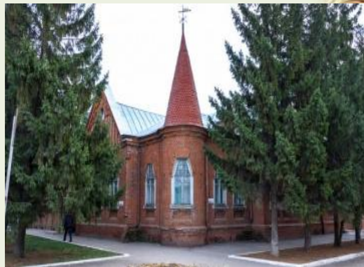
Музей истории города Балаково

Другой исторический музей, посвящённый самому городу, открылся в 1986 году в бывшей купеческой усадьбе. Созданный сотрудниками с нуля, в настоящее время он знакомит своих гостей со знаменитыми земляками и разными периодами истории – от старообрядческих истоков к сердцу волжского судоходства, от первых социалистических строек к современному промышленному и энергетическому центру.