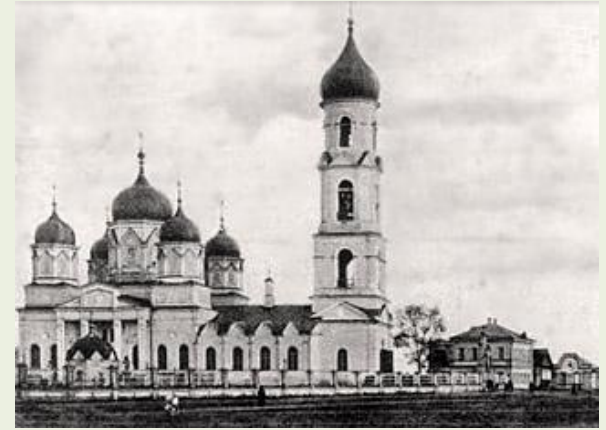
Храм Иоанна Богослова