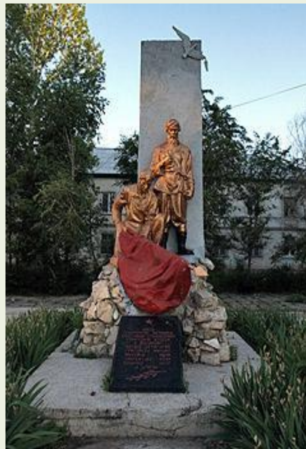
Памятник борцам революции