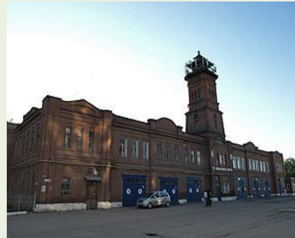
Пожарная часть с каланчой