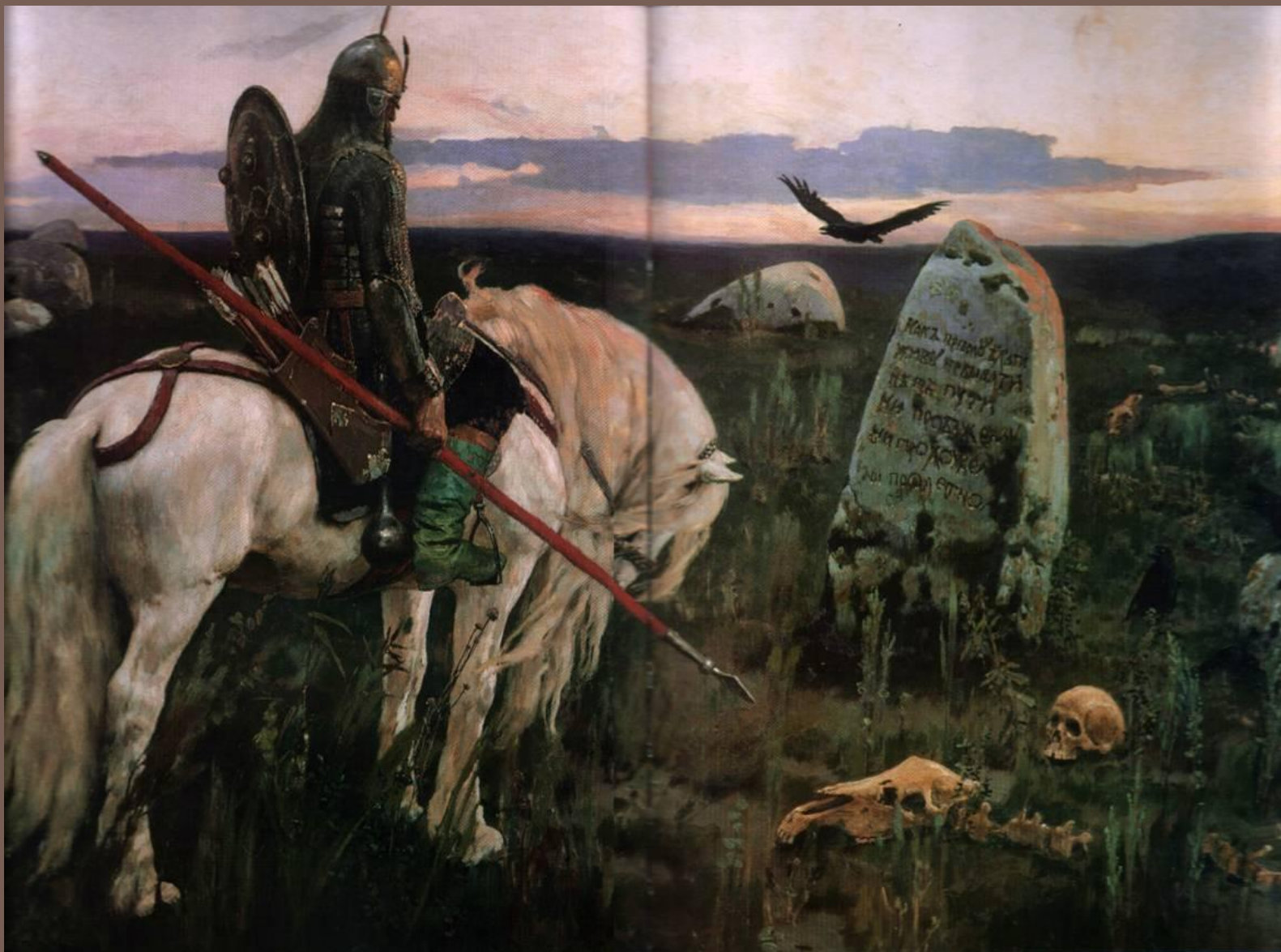
«Витязь на распутье»