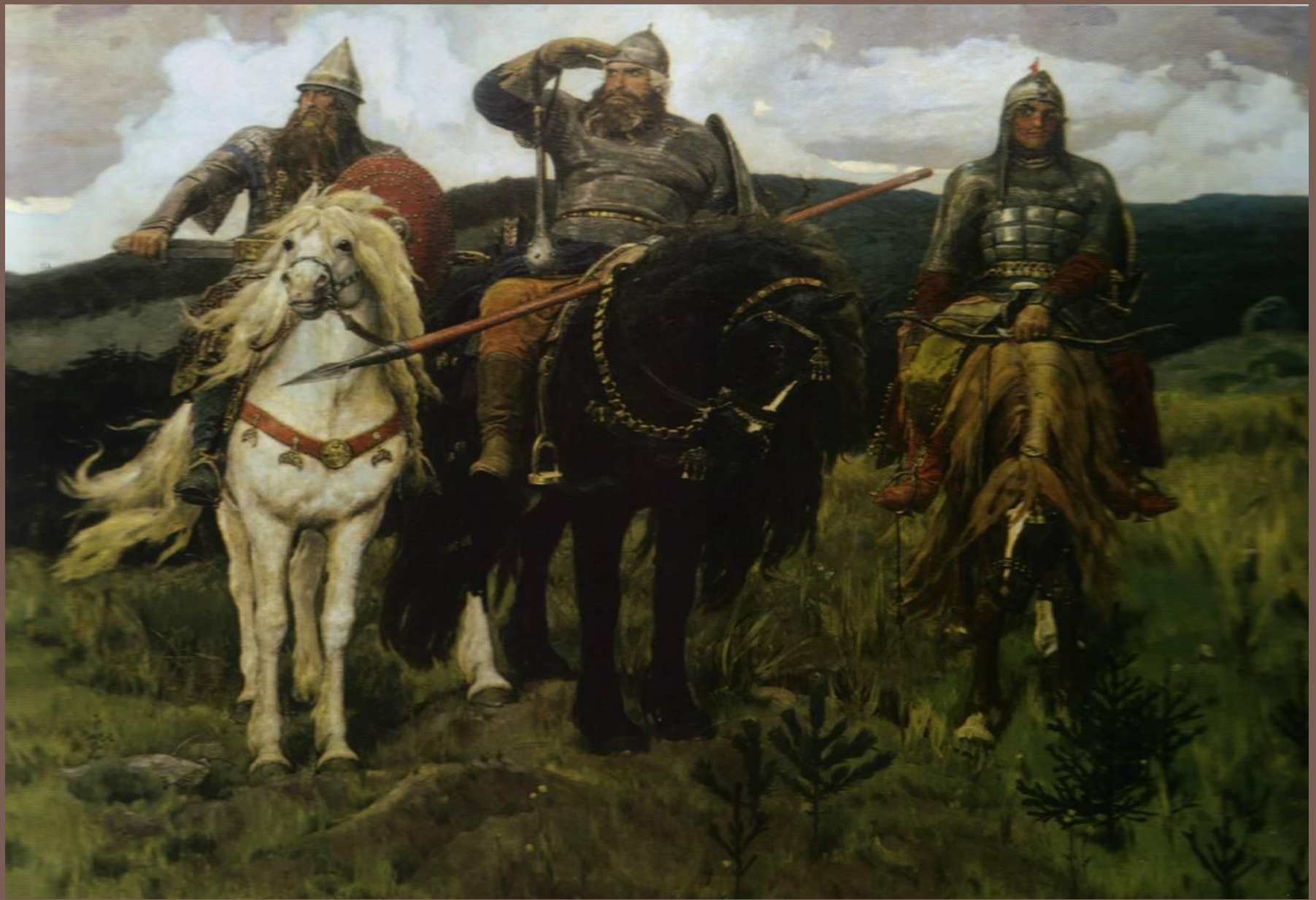
Картина «Богатыри» – любимое детище Виктора Михайловича Васнецова.