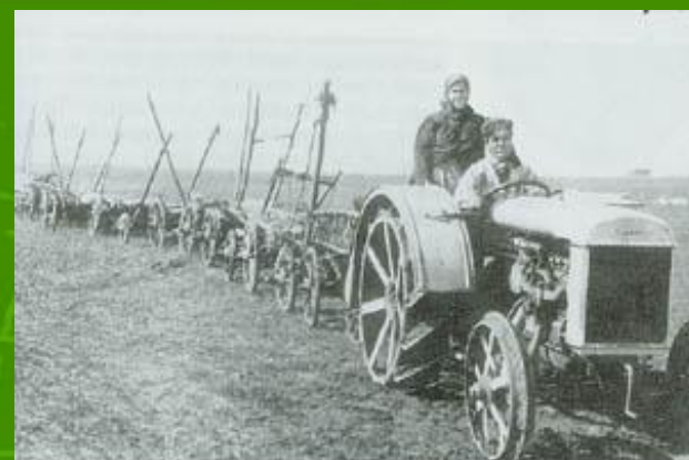
Новая техника на колхозных полях.