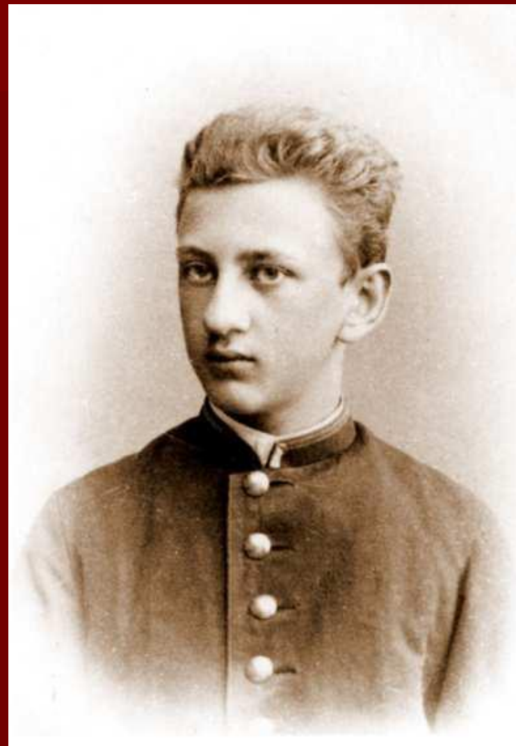
Выпускник реального училища. 1897 г.