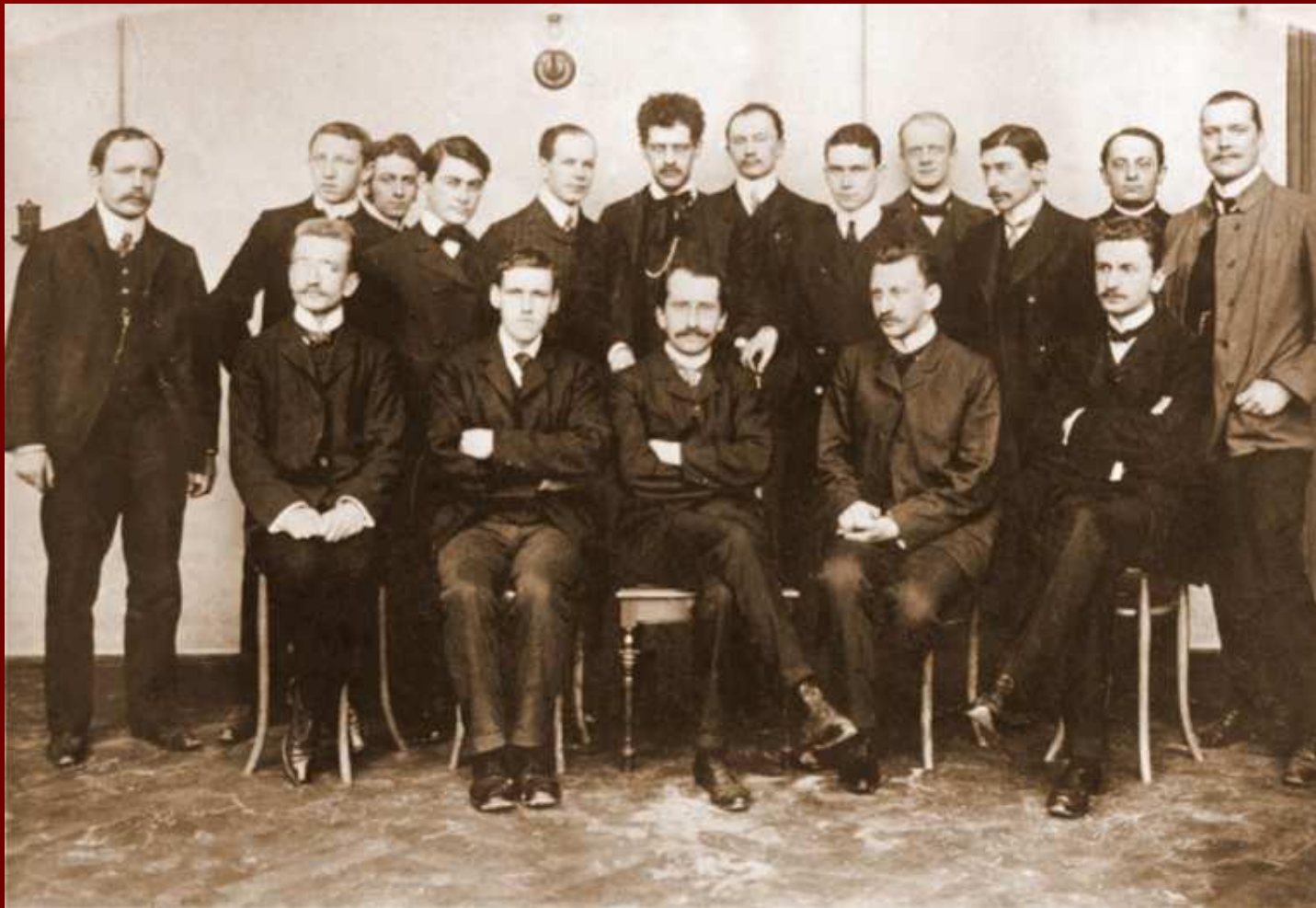
Иоффе (сидит 2-й слева) среди учеников и сотрудников Рентгена. 1904 г.