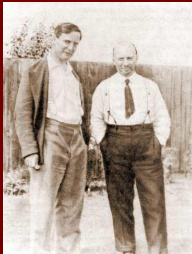
П.Л. Капица и Н.И. Бухарин во дворе кембриджского дома Капицы. Июль 1931 г.