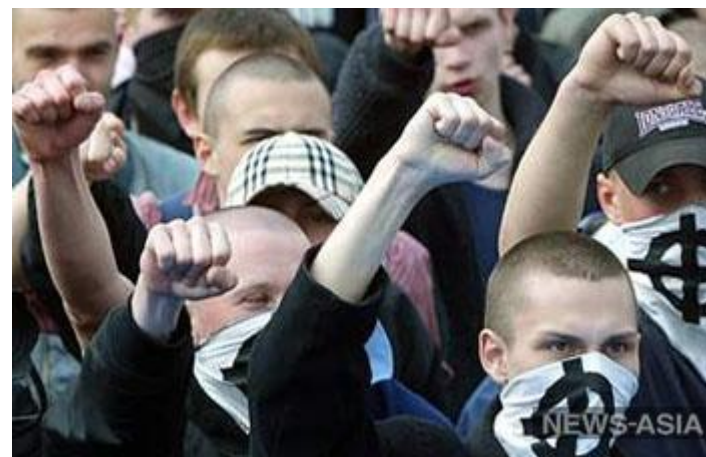
В Костроме скинхеды напали на неформалов