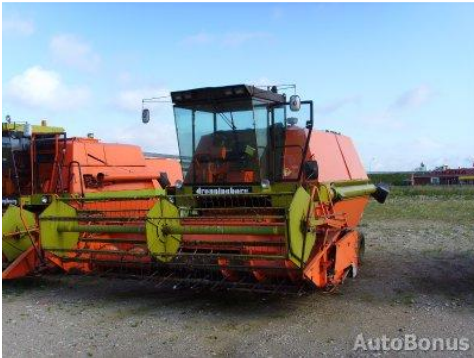
Так выглядят хлебоуборочные комбайны