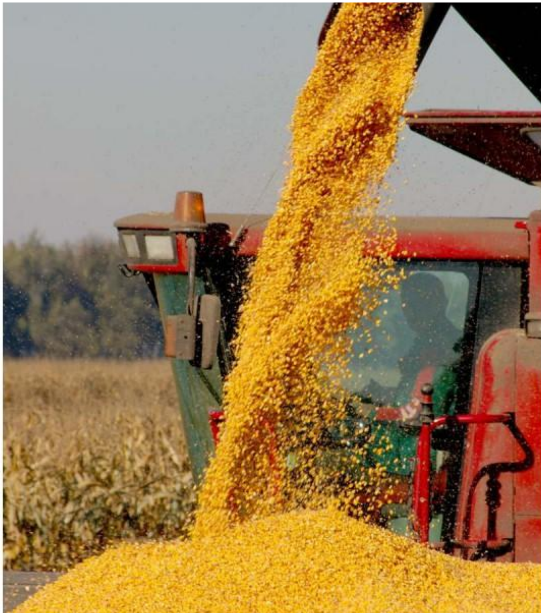
Богатый урожай хлеба