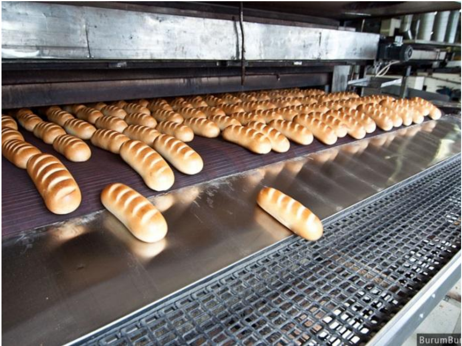
Готовый хлеб выходит из печи