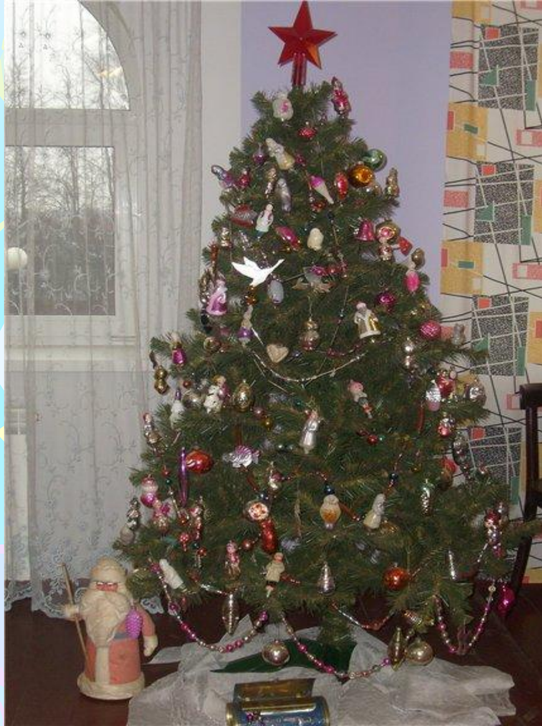
Новогодняя ёлка 50-60-70-х г.