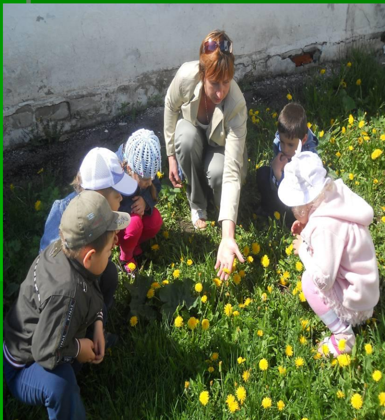
Был одуванчик золотой