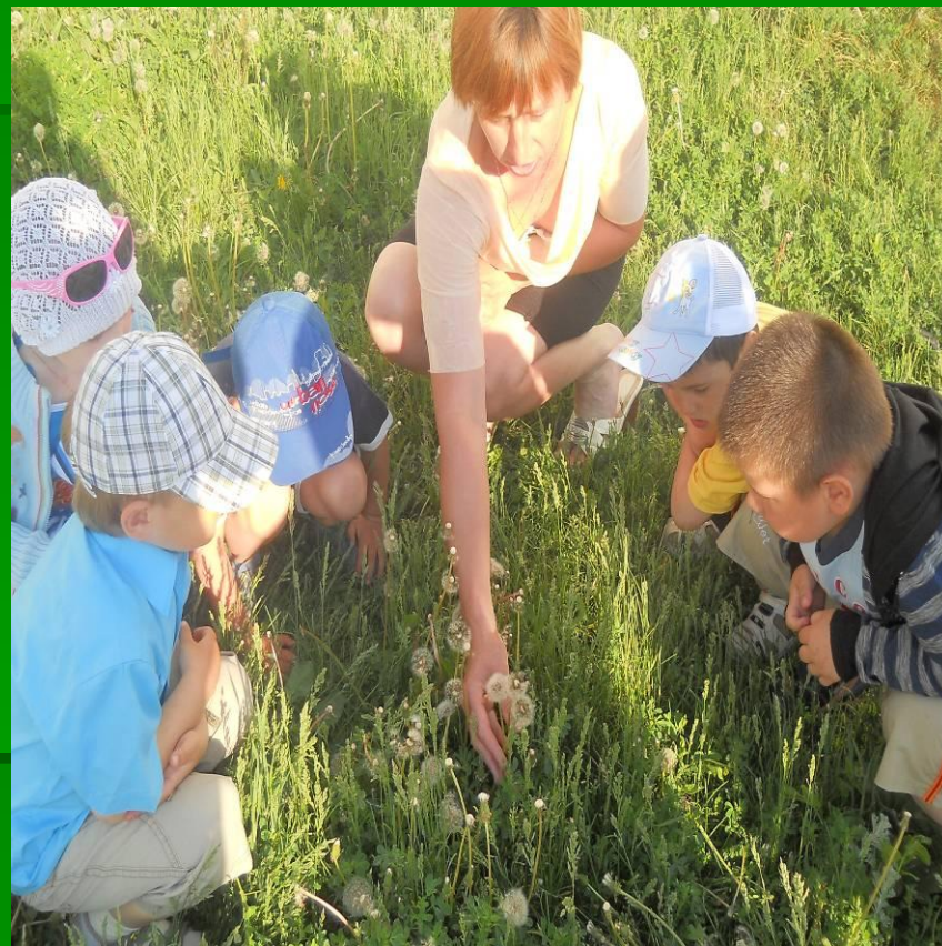
А теперь он стал седой