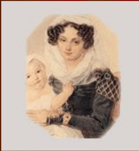
ВОЛКОНСКАЯ МАРИЯ НИКОЛАЕВНА (1807 - 1863)

Редееет облаков летучая гряда. Звезда печальная, вечерняя звезда! Твой луч осеребрил увядшие равнины, И дремлющий залив, и черных скал вершины. Люблю твой слабый свет в небесной вышине; Он думы разбудил, уснувшие во мне: Я помню твой восход, знакомое светило, Над мирною страной, где всё для сердца мило, Где стройны тополы в долинах вознеслись, Где дремлет нежный мирт и темный кипарис, И сладостно шумят полуденные волны. Там некогда в горах, сердечной думы полный, Над морем я влачил задумчивую лень, Когда на хижины сходила ночи тень - И дева юная во мгле тебя искала И именем своим подругам называла.