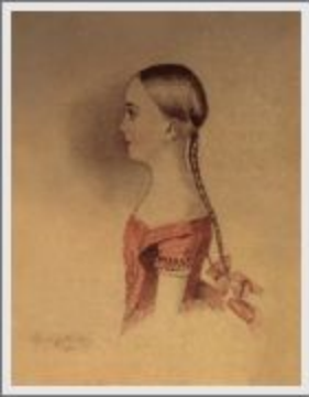
ПУШКИНА МАРИЯ АЛЕКСАНДРОВНА (1832 - 1919)