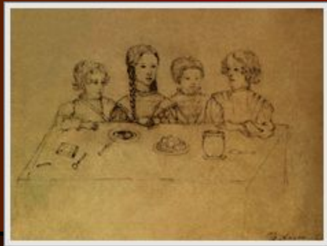
ПУШКИНА НАТАЛЬЯ АЛЕКСАНДРОВНА (1836 - 1913)