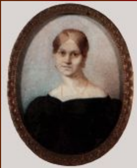
Керн Анна Петровна (1800 - 1879)

Я помню чудное мгновенье: Передо мной явилась ты, Как мимолетное виденье, Как гений чистой красоты.