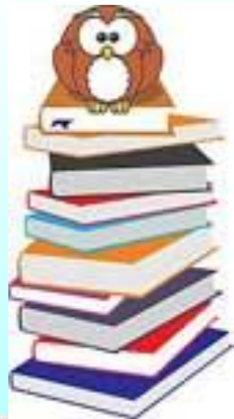
Таблица 3. « Книги, которые я читаю.»