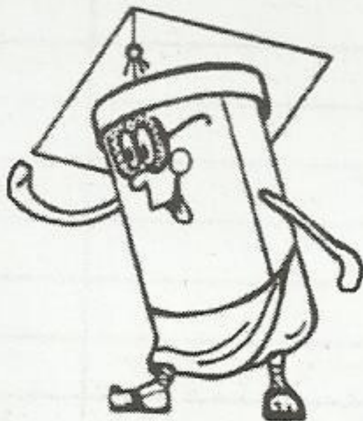
Рис. 1. Пример оформления значка "Знаток сложения и вычитания столбиком"