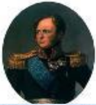
Император Александр I