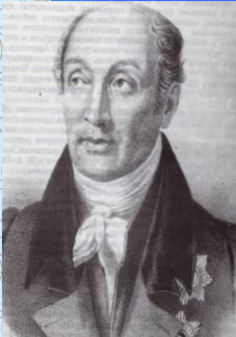
Государственный деятель Сперанский М.М.