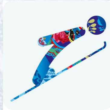
Прыжки с трамплина