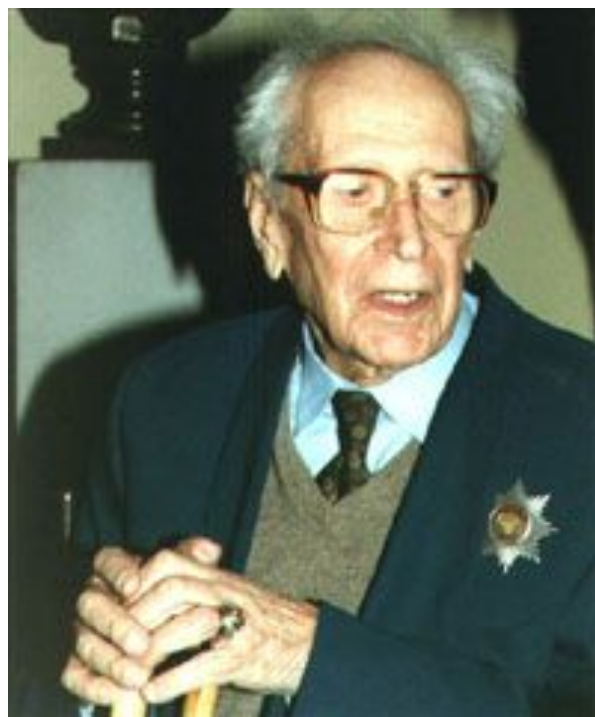
ЛИХАЧЕВ Дмитрий Сергеевич (1906 - 1999гг.)