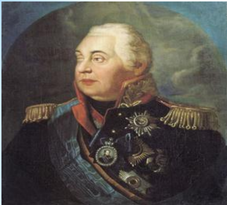
Михаил Илларионович Кутузов