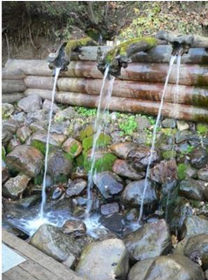
Святой источник преподобного Сергия Радонежского