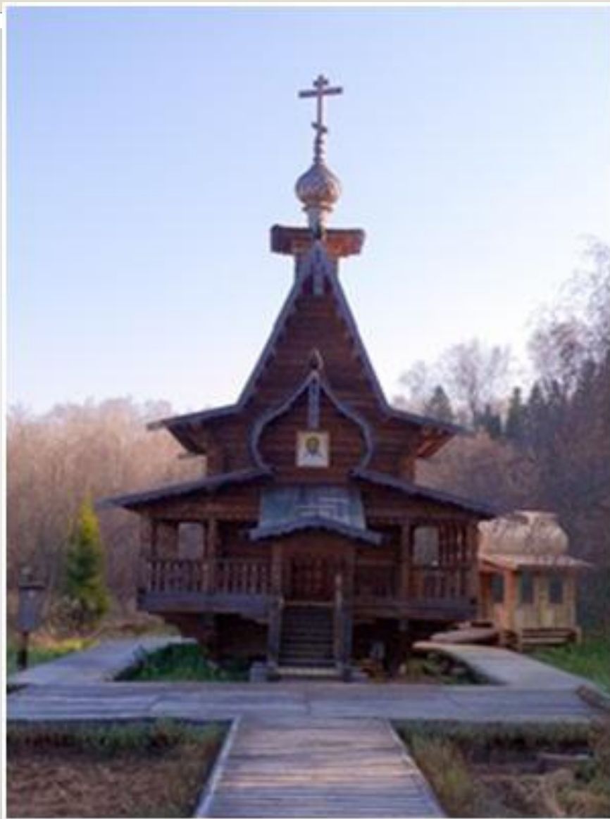
Часовня Сергия Радонежского у водопада Гремячий