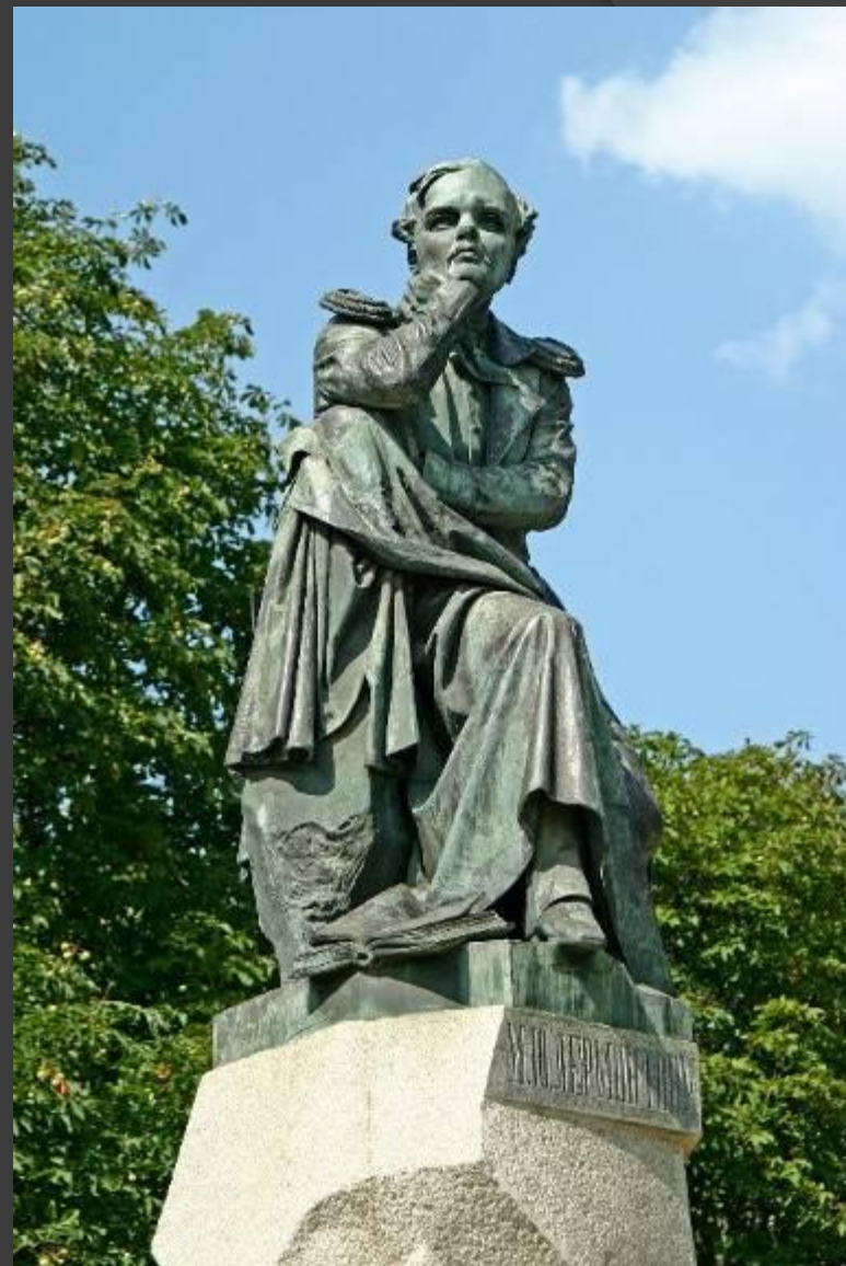
Это первый в России памятник М. Ю. Лермонтову,