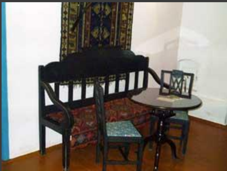
Стол, за которым работал Лермонтов