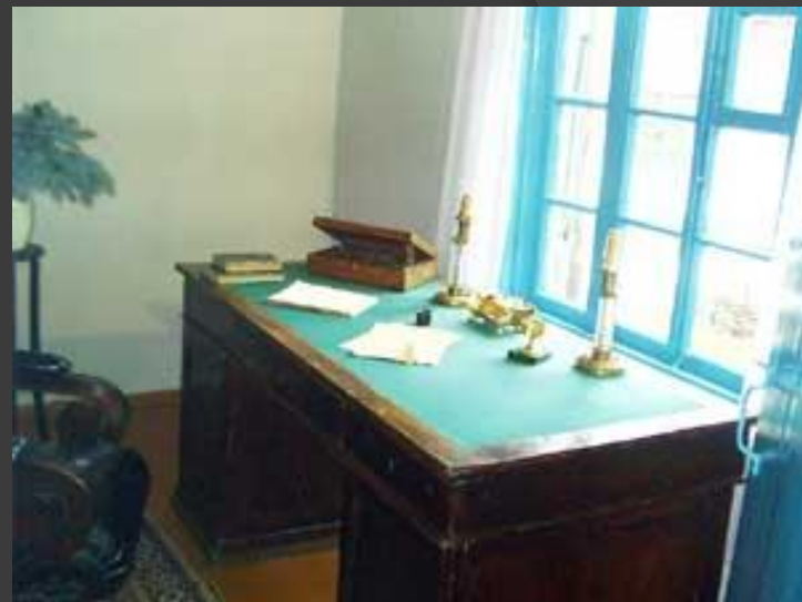
Стол и кресло Лермонтова