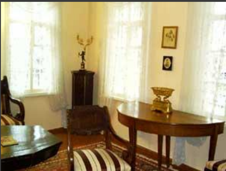
В этой комнате был вызван на дуэль Лермонтов ( все считают , что это было политическим, запланированным убийством)