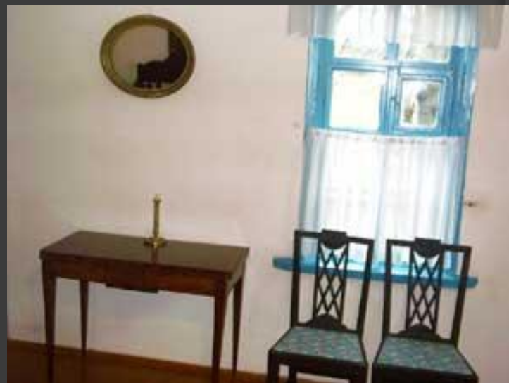
Лермонтовская половина дома