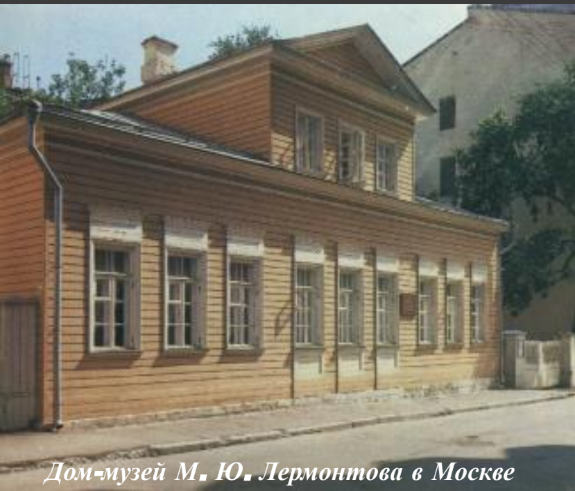
Дом-музей М. Ю. Лермонтова в Москве