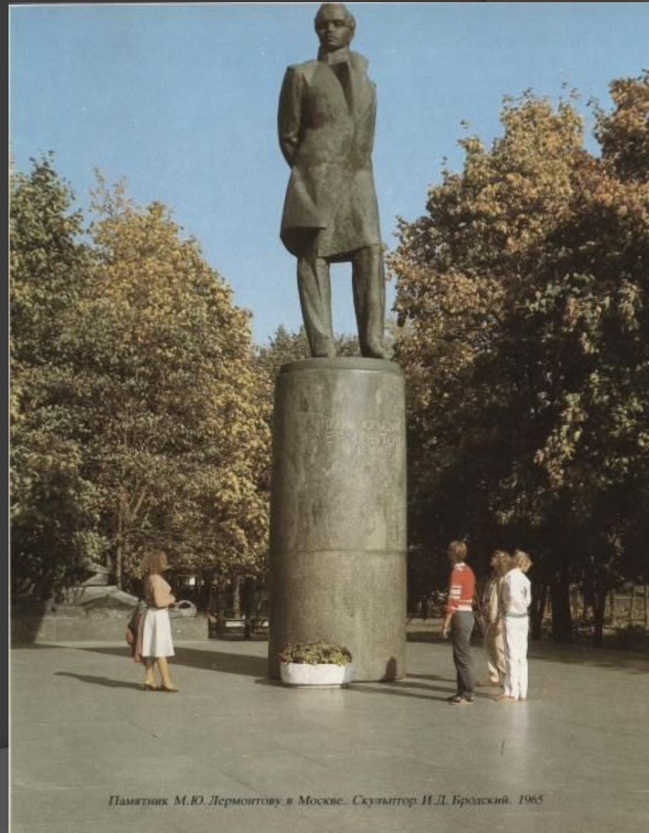
Памятник М.Ю. Лермонтову в Москве. Скульптор И.Д. Бродский. 1965