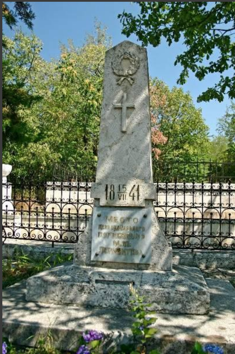
Место первоначального погребения Лермонтова в Пятигорске