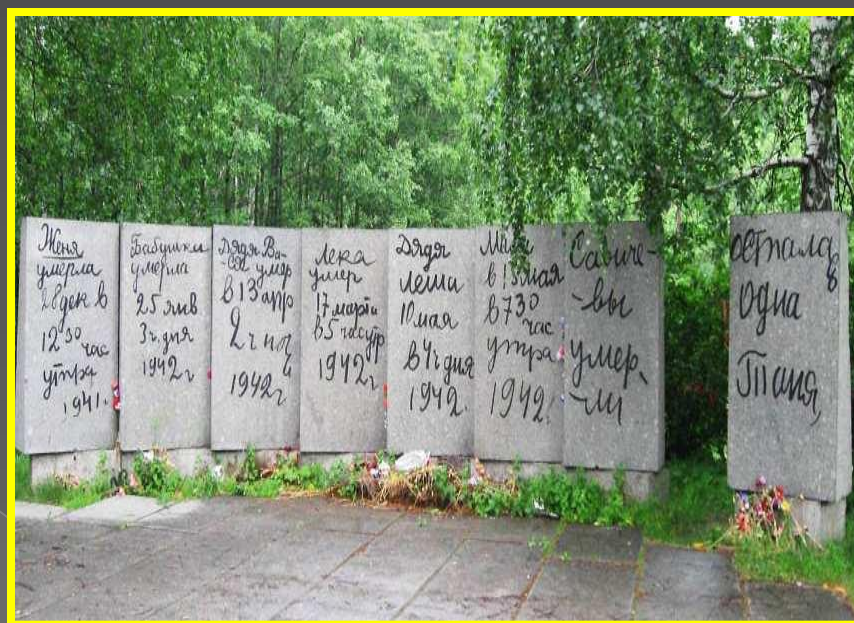
Памятник семье Савичевых

Таня Савичева жила в ленинградской семье. Началась война, затем блокада. На глазах Тани погибли её бабушка, двое дядей, мама, брат и сестра. Когда началась эвакуация детей, девочку удалось вывезти по Дороге Жизни на «Большую землю». Врачи боролись за её жизнь, но медицинская помощь пришла слишком поздно. Таня Савичева умерла от истощения.