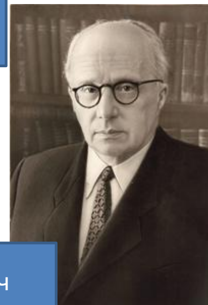
Сергей Леонидович Рубинштейн

Деятельностный подход в обучении опирается на работы Л.С. Выготского, П.Я. Гальперина, А.Н. Леонтьева, С.Л. Рубинштейна