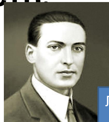
Лев Семенович Выготский