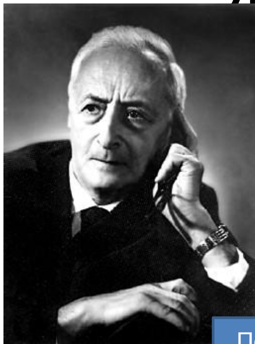
Петр Яковлевич Гальперин