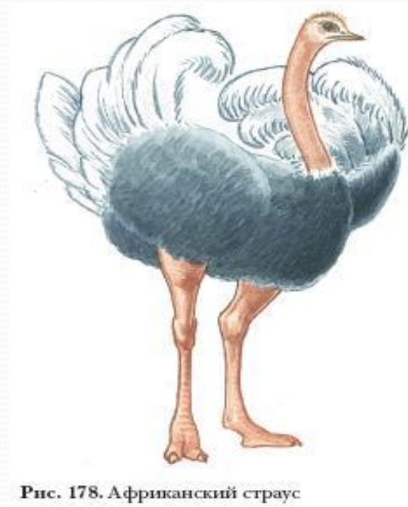
Рис. 178. Африканский страус