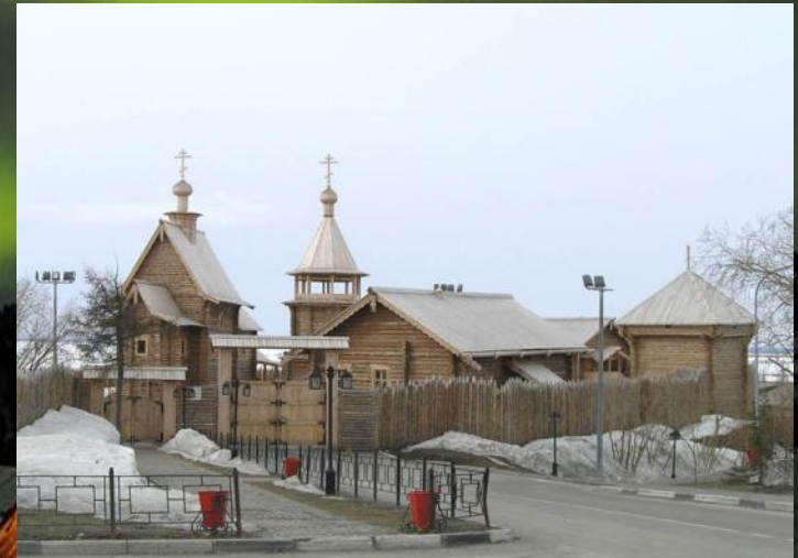
Центральный вход в