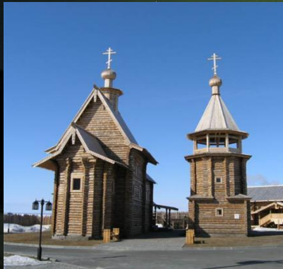
Храм Василия Великого