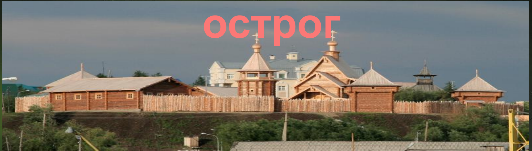
Панорамный вид музея