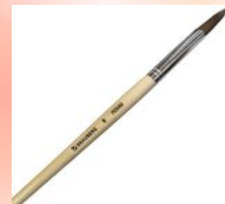
кисточка для смачивания теста