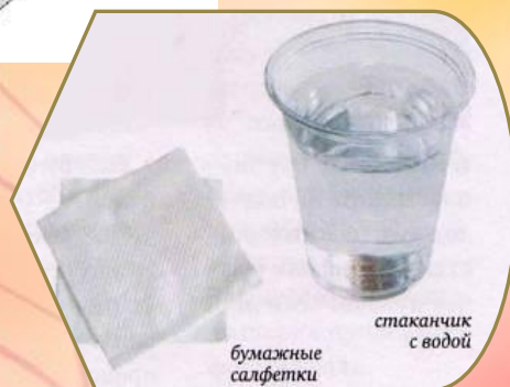
Баночка с водой