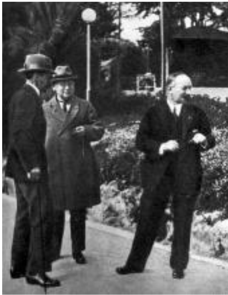
Советская делегация в Генуе.

Тогда советская делегация сосредоточила усилия на переговорах с Германией. 16 апреля 1922 г.в Раппало был подписан договор об установлении дипломатических отношений, отказе от взаимных претензий и широких экономических контактах между РСФСР и Германией Дипломатическая «бло-када» была прорвана. Докажите, что это послужило началом тесного военно-технического сотрудничества СССР с Германией (у. 142)