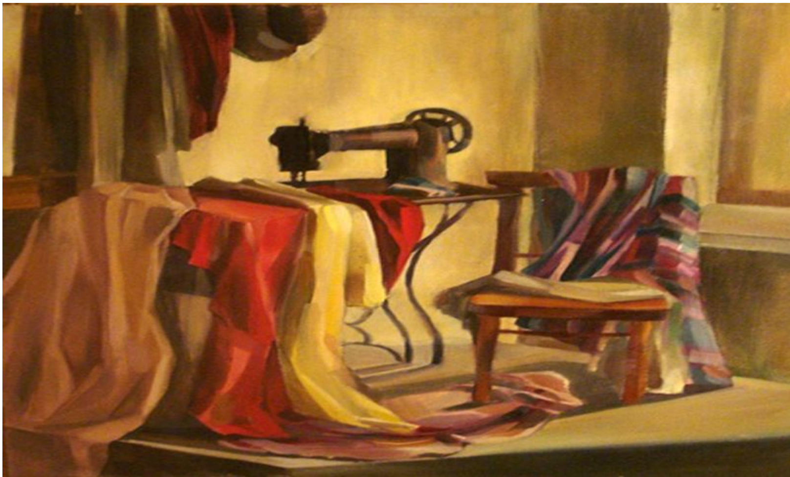
Яковлева Наталья. Натюрморт с швейной машинкой.