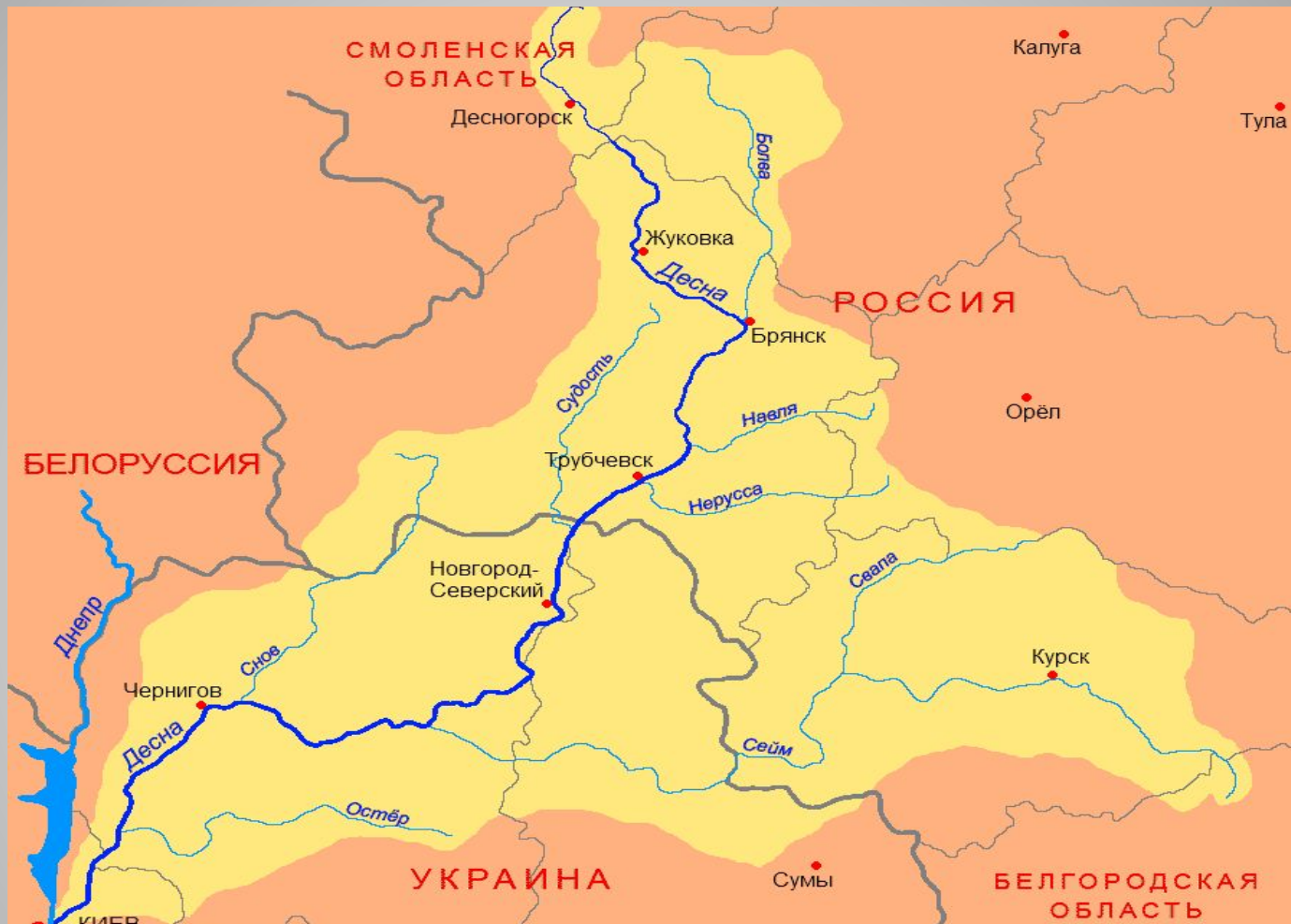
Карта бассейна реки Десны