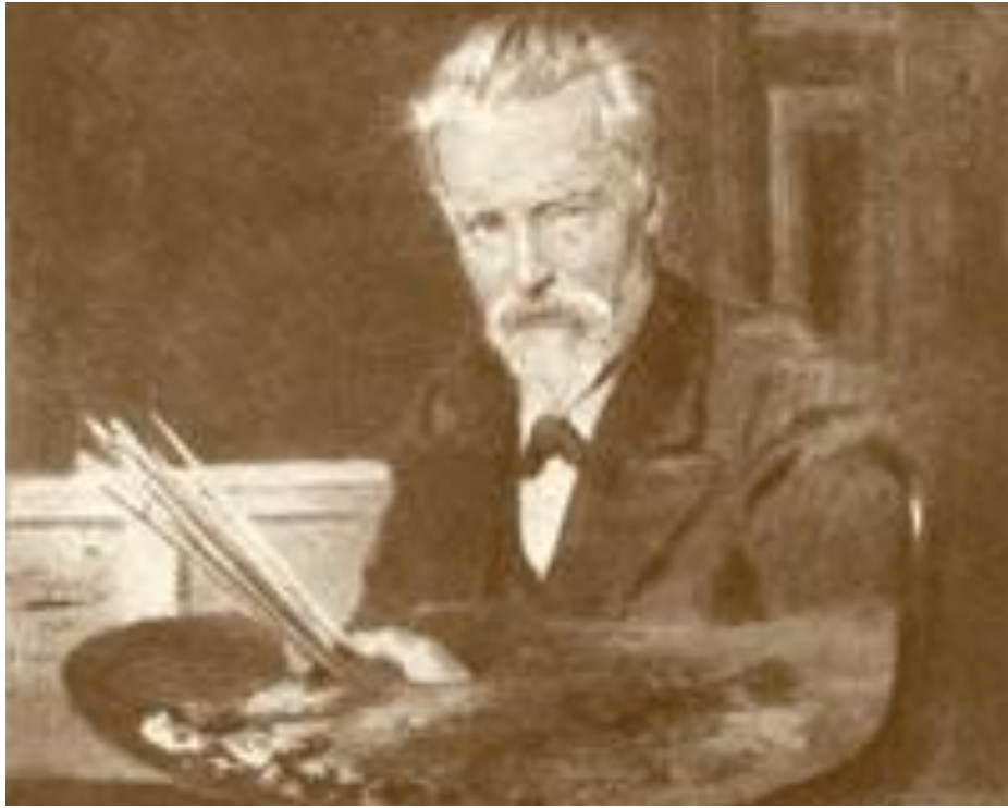
Маковский Владимир Егорович