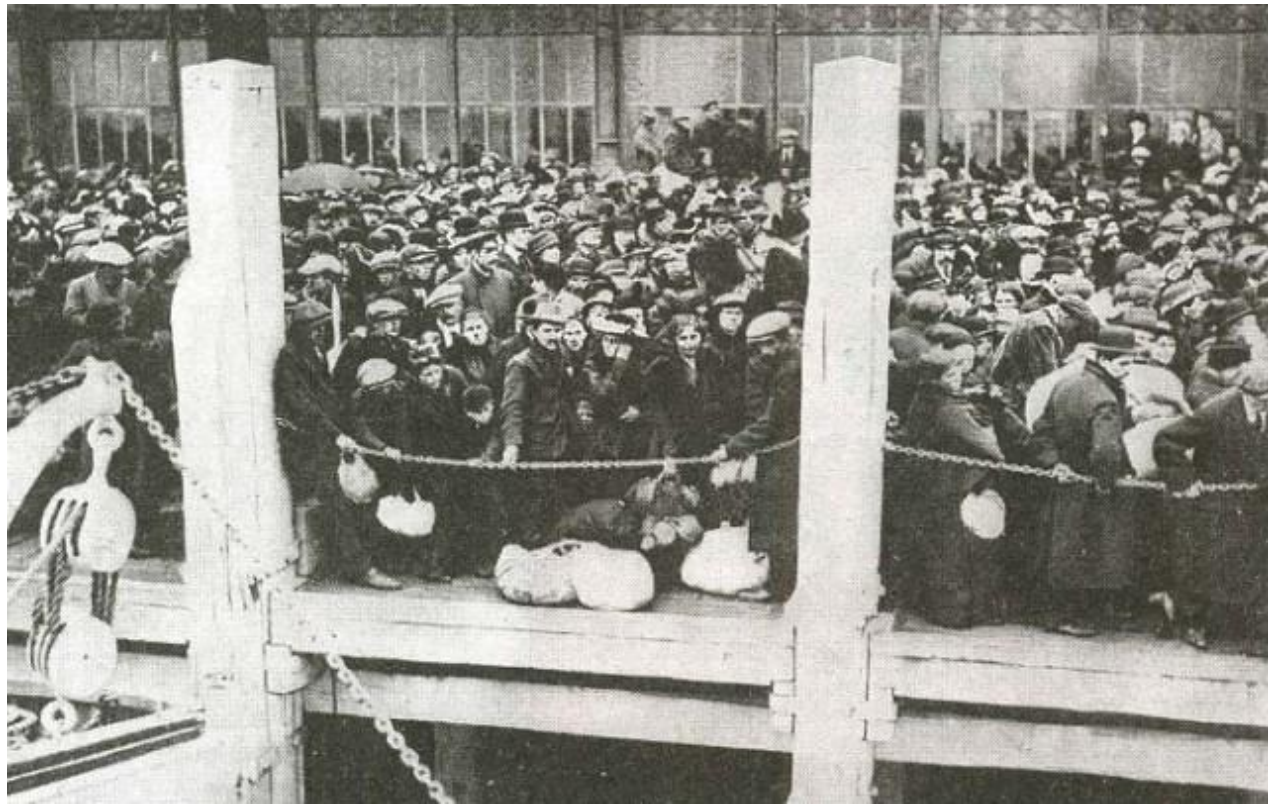
Бельгийские беженцы в первые годы