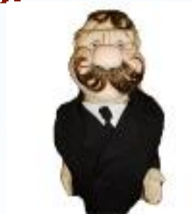
Администратор торгового зала, товаровед