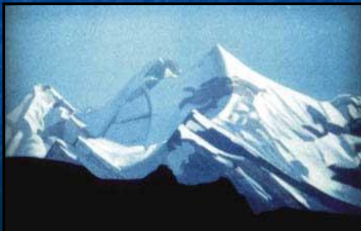
С. Рерих. Гепан Лагул.