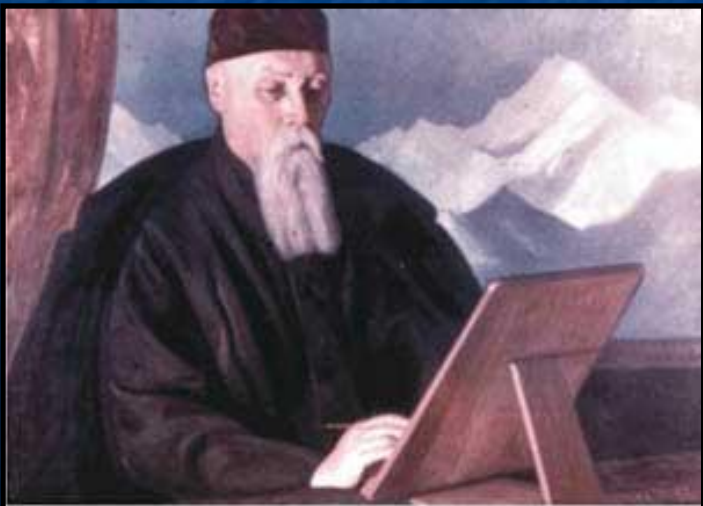
С. Рерих. Портрет отца .1931г.