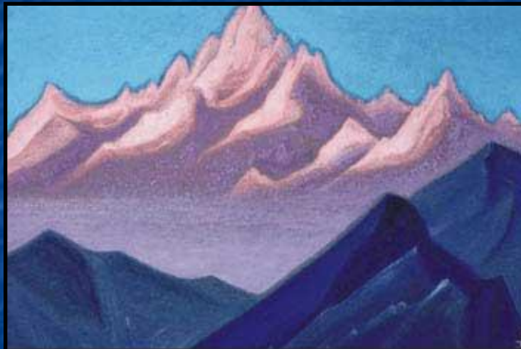
Н. Рерих. Гималаи. 1943 г.