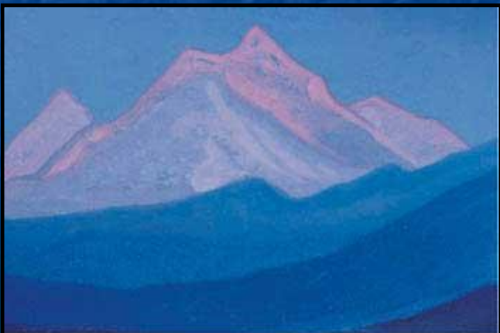
Н. Рерих. Гималаи. 1943 г.