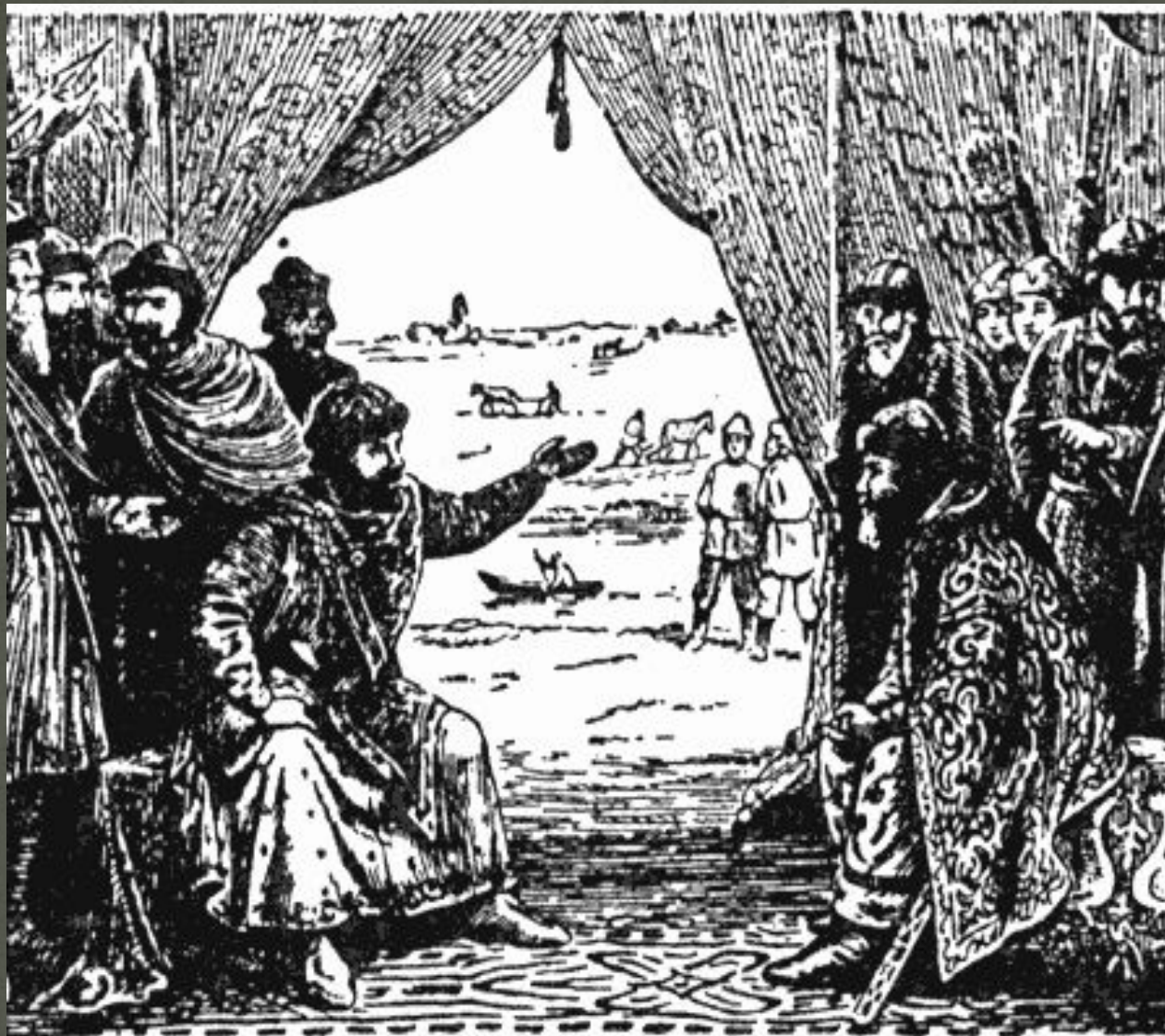
Владимир Мономах на совете князей.

На момент приглашения в Киев Мономах правил в своей вотчине Переяславле. Ему было уже 60 лет, и он успел проявить себя и как талантливый полководец, и как государственный деятель, и как человек высокой культуры. Владимира Мономаха уже давно знала Русская земля.