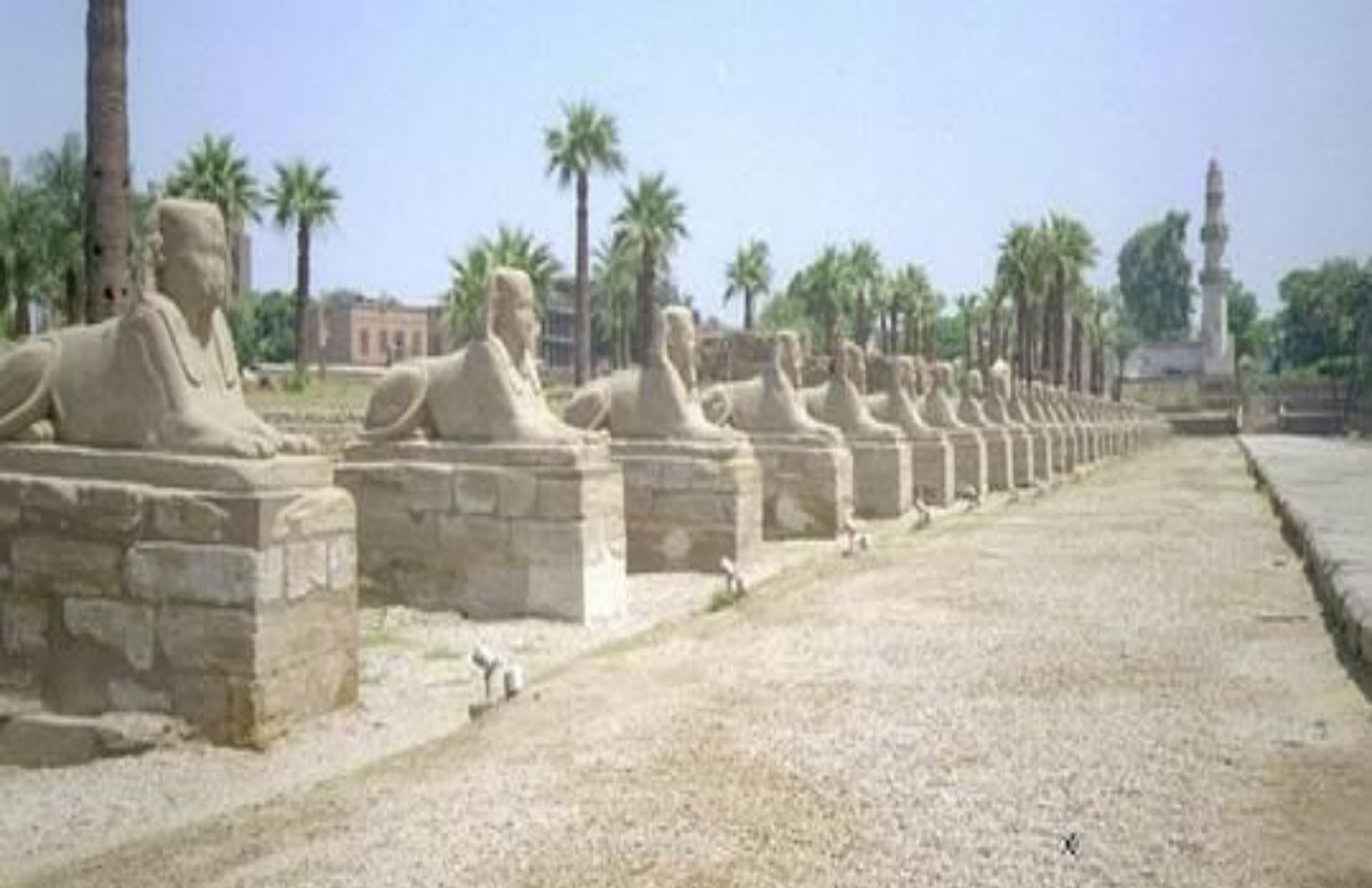
Аллея сфинксов в Луксоре