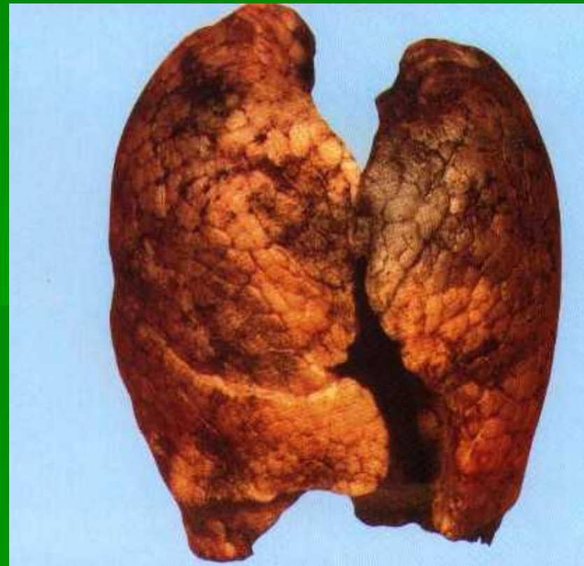
Лёгкие курящего человека