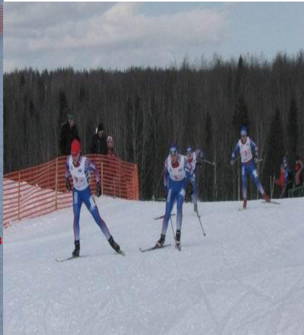
Таблица итоговых результатов индивидуального спринта формируется в таком порядке: результаты финала А, результаты финала В, участники четвертьфиналов, не прошедшие квалификацию участники.

Количество спортсменов, отбираемых в финальные забеги, не превышает 30. Сначала проводятся четвертьфиналы, затем полуфиналы и, наконец, финалы В и А. В финале В принимают участие спортсмены, не прошедшие в финал А.