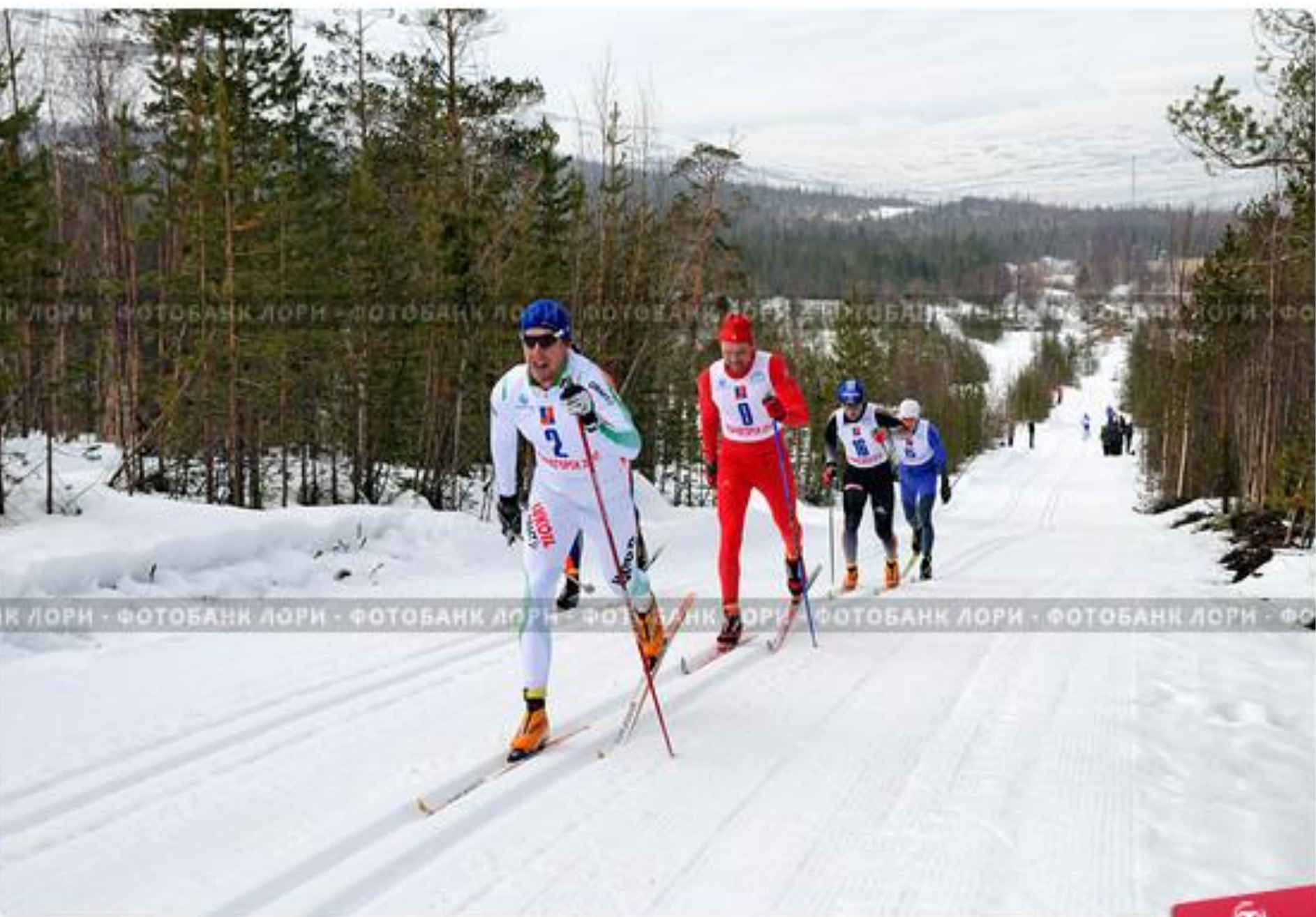
Чемпионат России по лыжным гонкам среди мужчин