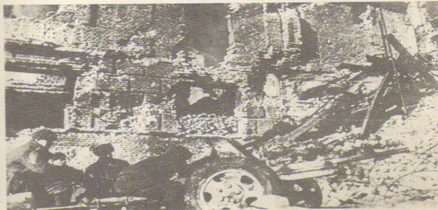
Отважные гвардейцы-артиллеристы 62-й армии в тяжелые сентябрьские дни 1942 г. в жарких уличных боях смело и стойко защищали родной Сталинград.

Оборонительный период битвы продолжался 125 дней, с 17 июля по 18 ноября 1942 года и распадался на три периода: