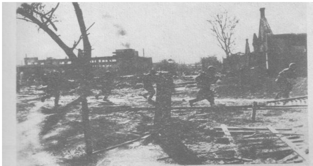
Отважные десантники-гвардейцы 39-й стрелковой дивизии и ополченцы города-героя Сталинграда наносят последние удары гитлеровским захватчикам на территории завода «Красный Октябрь», январь, 1943 г.