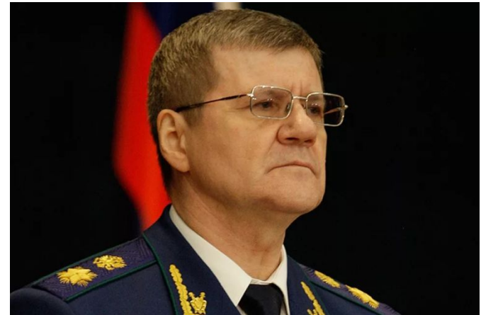
Чайка Юрий Яковлевич Генеральный прокурор РФ с 2006 года

Генеральный прокурор Российской Федерации назначается на должность и освобождается от должности Советом Федерации Федерального Собрания Российской Федерации по представлению Президента Российской Федерации на 5 лет.