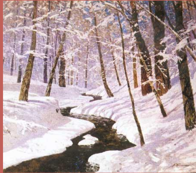
П.М. Гречишкин. Зимний лес, 1971 г.