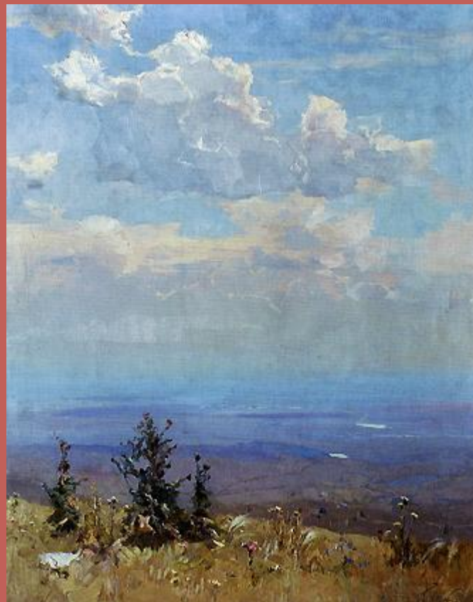
П.М. Гречишкин. Простор, 1957 г.

Я видел Ставрополье на картинах, в окно вагона, через дым костров... Лежит оно в равнинах и горбинах, лежит на стыке четырёх ветров. Здесь голубые облака гороха и голубой полыни облака, и за людьми на динамичный грохот в степную марь торопится река. Здесь мериносы ноги моют в росах, метёлки проса – словно бьют ключи, и от зари расходятся прокосы, широкие, прямые, как лучи... Поля вплотную подступили к сёлам. Из сёл, в разведку выслав тополя, сады выходят воинством весёлым и смело наступают на поля. Ах, Ставрополье, синий край России, Ты - песня эскадронная отцов. Меня сады, поля твои растили под птичий гай и перезвон овсов. Мне открывали даль твои рассветы, А стрепеты - немятую траву... Куда б меня не заманили ветры- тебя от сердца я не оторву.