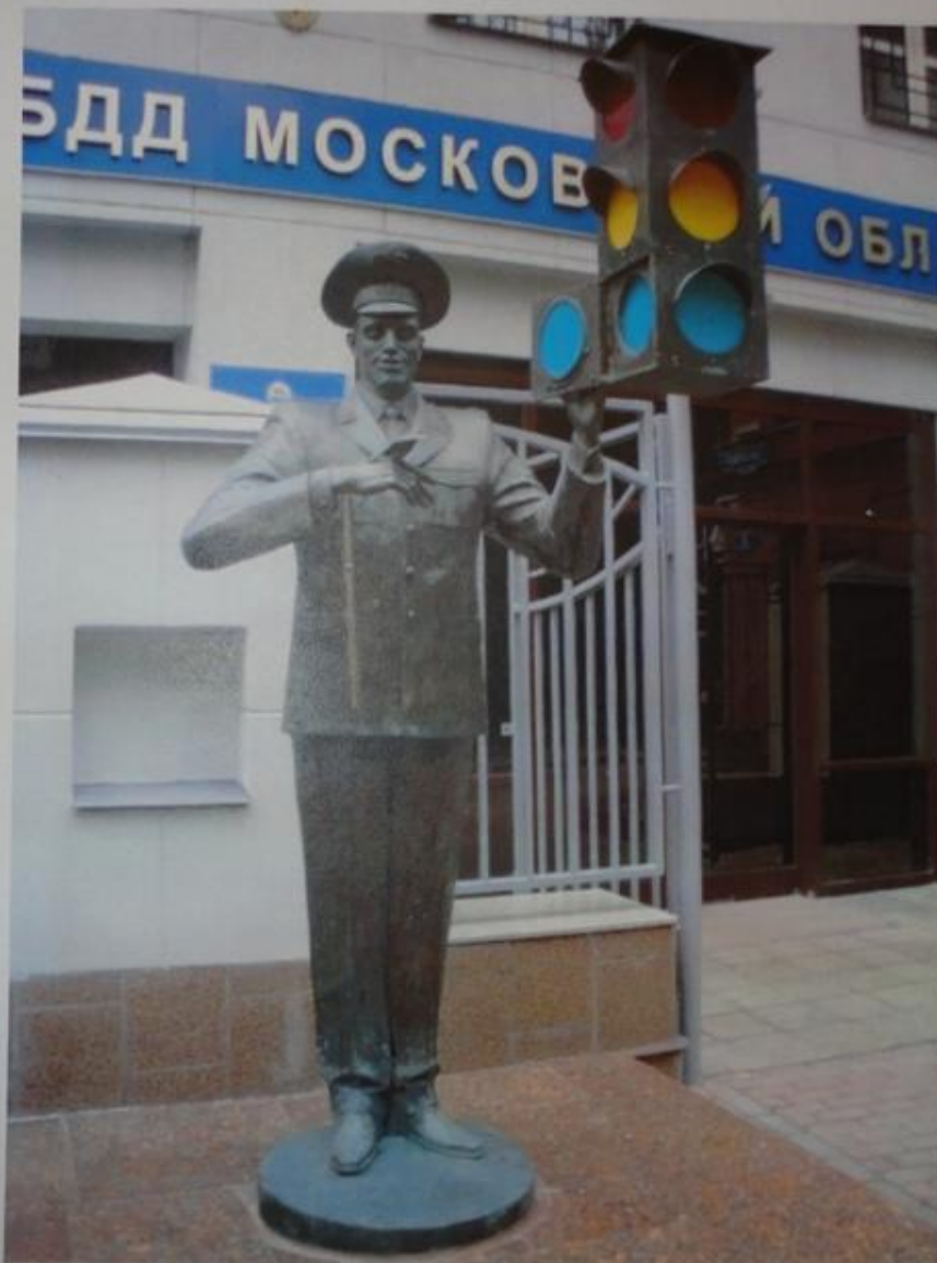
Памятник Дяде Стёпе, установленный в Москве, в Слесарном переулке, д.1 перед зданием Управления ГИБДД Московской области