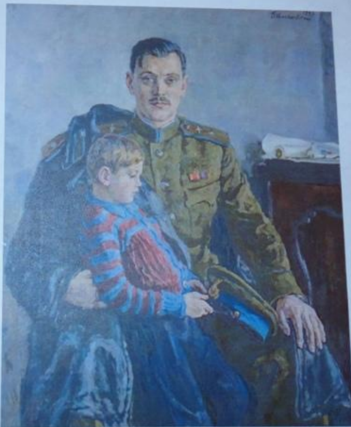
Портрет поэта Сергея Владимировича Михалкова с сыном (художник Кончаловский П.П.)