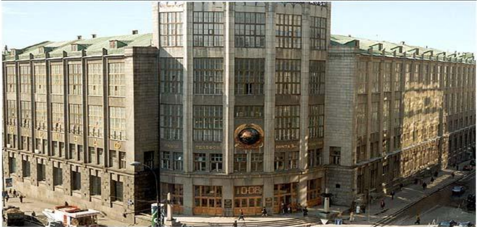
1929 г. - открыт Центральный телеграф на ул. Тверская, 7

Впервые водопровод появился в Москве в 1804 году. А систему канализации построили в 1898. Московский телеграф заработал в 1872 году, а первые телефоны начали звонить у москвичей в 1882. Лифт в Москве впервые был построен в 1901 году.