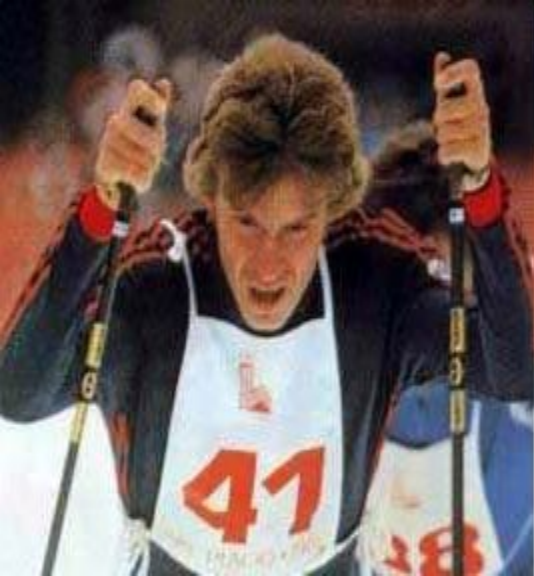
Зимятов Николай Семенович спортсмен-лыжник, четырехкратный олимпийский чемпион, серебряный призер Олимпийских игр