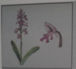
Ятрышник шлемоносный Orchis militaris СЕМЕЙСТВО ЯТРЫШНИКОВЫЕ