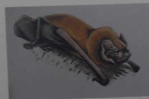
Гигантская вечерница Nyctalus lasiopterus Schreber ОТРЯД РЫКОКРЫЛЫЕ СЕМЕЙСТВО ПЯДКОНОСЫЕ