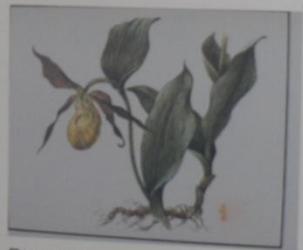
Башмачок настоящий Cypripedium calceolus СЕМЕЙСТВО ЯТРЫШНИКОВЫЕ