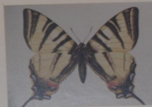
Подалирий Iphiclides podalirius ОТРЯД ЧЕШУЕКРЫЛЫЕ СЕМЕЙСТВО ПАРУСНИКИ