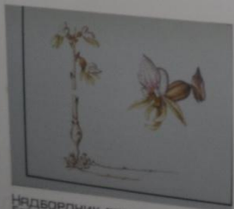
Надборзник безлиственный Epipodium arhullum СЕМЕЙСТВО ЯТРЫШНИКОВЫЕ