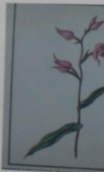
Пальчеголовник Cephalanthera rupestris СЕМЕЙСТВО ЯТРЫШНИКОВЫЕ