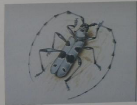
Усач альпийский Rosalia alpina ОТРЯД ЖЕСТКОКРЫЛЫЕ СЕМЕЙСТВО УСАЧИ