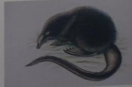
Выхухоль Desmana moschata Linnaeus