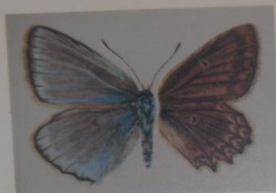
Голубянка мелеагр Polyommatus daphis ОТРЯД ЧЕШУЕКРЫЛЫЕ СЕМЕЙСТВО ГОЛУБЯНКИ