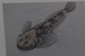
Обыкновенный подкаменщик Cottus gobio Linnaeus ОТРЯД СКОРПЕНООБРАЗНЫЕ СЕМЕЙСТВО КЕРЧАКОВЫЕ