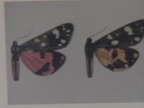
Медведица - госпожа Callimorpha dominula ОТРЯД ЧЕШУЕКРЫЛЫЕ СЕМЕЙСТВО МЕДВЕДИЦЫ