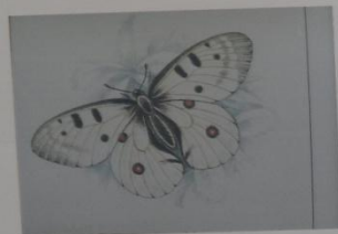
Аполлон Parnassius apollo ОТРЯД ЧЕШУЕКРЫЛЫЕ СЕМЕЙСТВО ПАРУСНИКИ