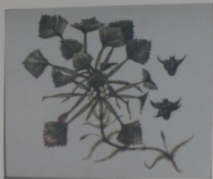
Водяной орех Чилим Trapa natans СЕМЕЙСТВО ТРАПАСЕЕ