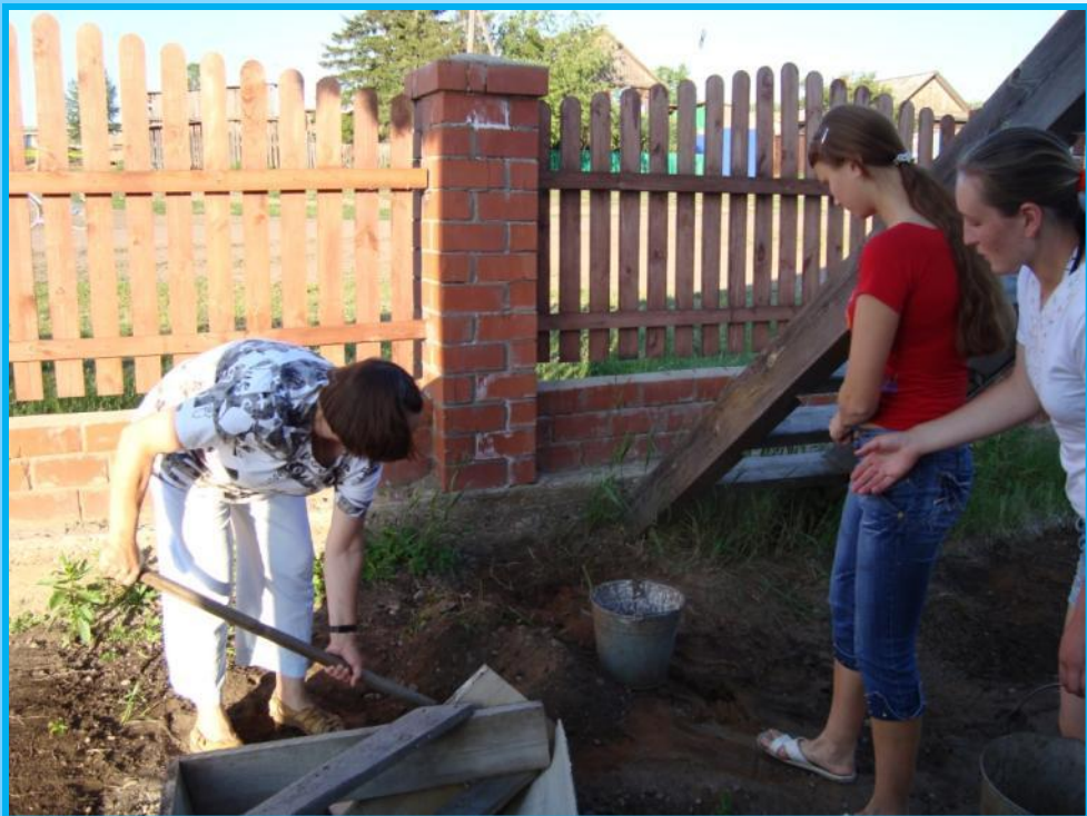
Разбивка газона силами школьной производственной бригады, весна 2009 года.