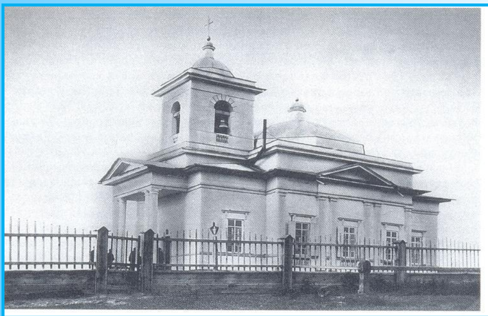
Храм Пресвятой Троицы в селе Каменка Боханского района в дореволюционный период. Фото начала XX в.

Известно, что Троицкая церковь в числе других 42 церквей была причислена к учрежденному в 1706 Иркутскому викариатству. Дальнейшая судьба этой постройки неизвестна, но в 1752 году (по другим сведениям – в 1782) строится новая деревянная теплая (зимняя) церковь во имя Святой Троицы, которая в 1845 году после ремонта была переименована в Покровскую. В 1838 рядом с ней строится еще одна деревянная холодная (летняя) церковь Святой Троицы. Располагались обе церкви в уединенном месте, в двух верстах от села Верхне-Острожное и в полуверсте от села Нижне-Острожное. После советского периода обе церкви не сохранились (из книги И.В.Калининой «Православные храмы Иркутской епархии»)