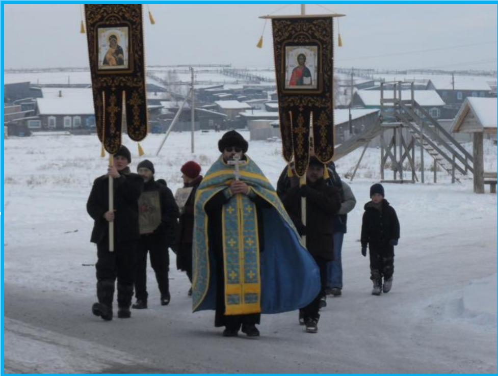
Первый крестный ход по улицам села