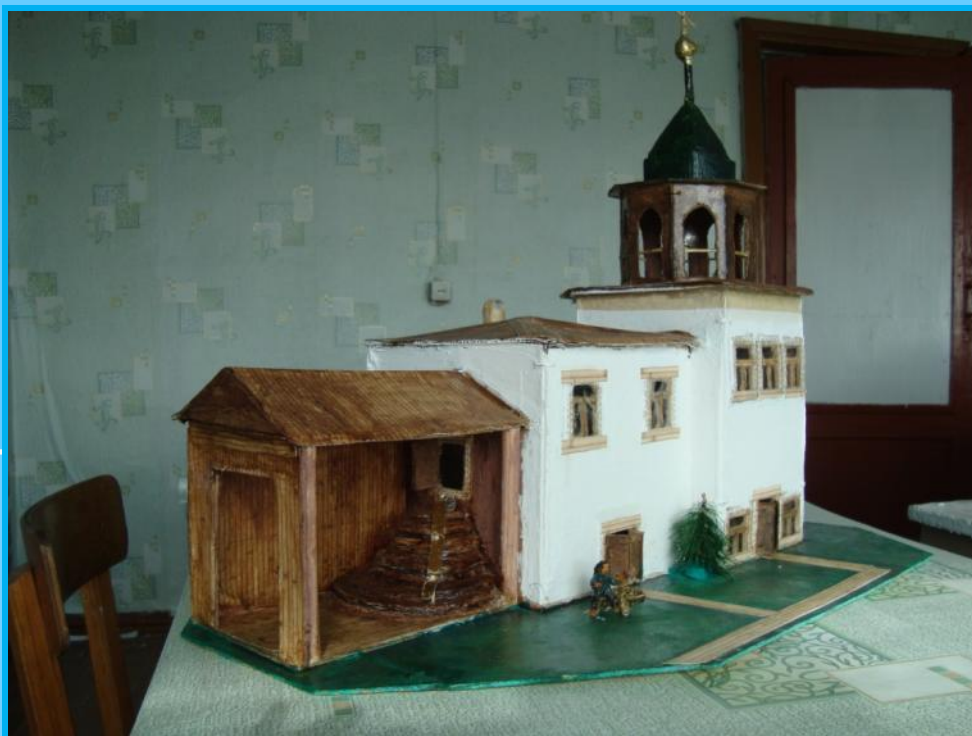
Макет Покровского храма