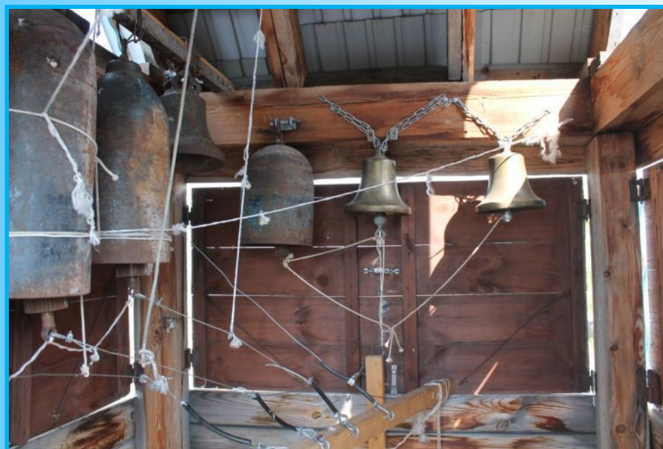
Колокольня храма. Настоящих колоколов пока два, слева – била