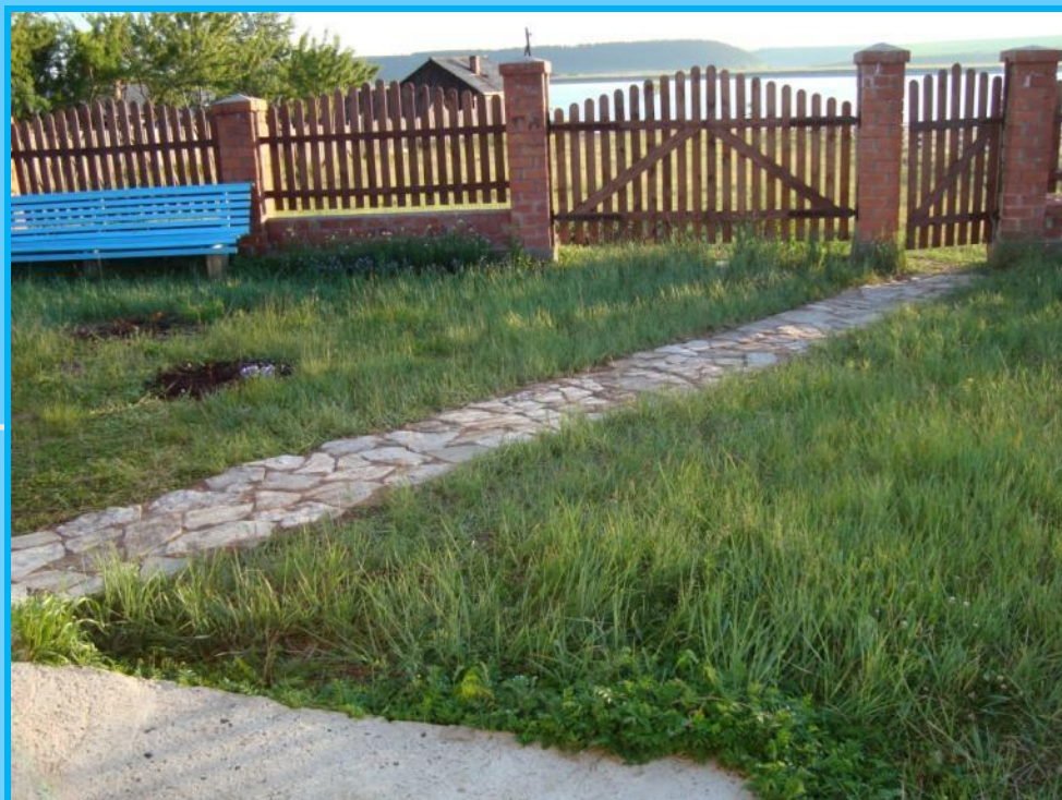
Дорожка из природного камня сделанная руками членов школьной производственной бригады, лето 2009 года.