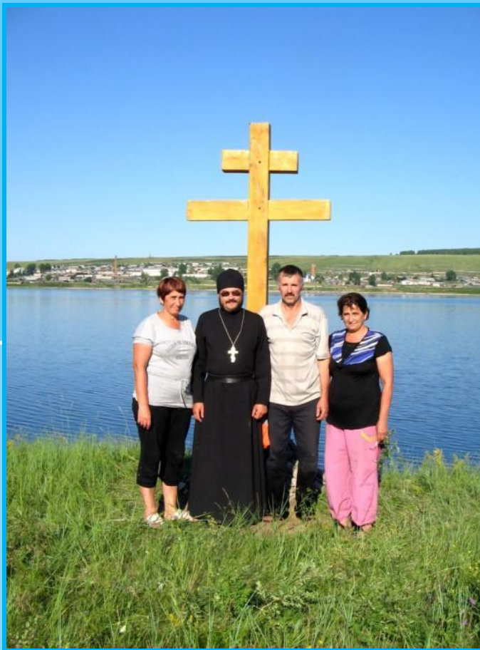
Установка поклонного креста на острове, напротив села Каменка