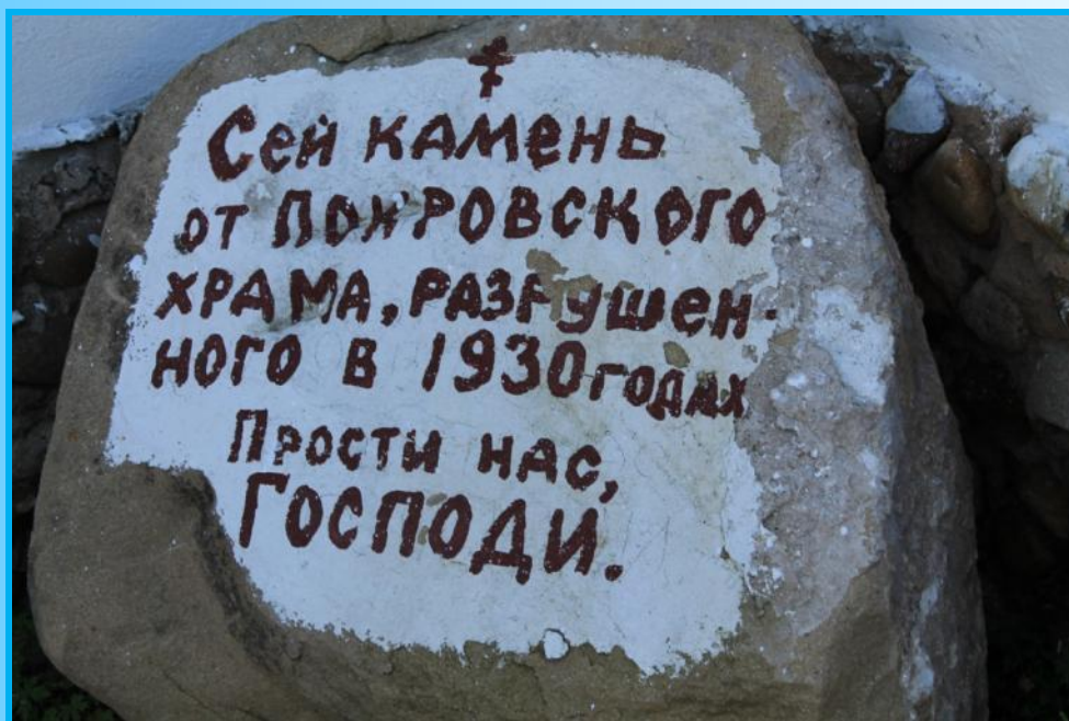
камень от фундамента Покровского храма