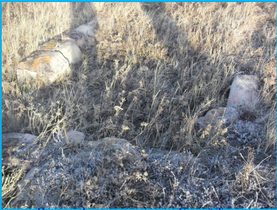
Остатки фундамента църкви Святой Троицы