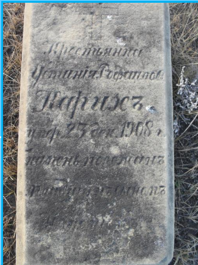
Надгробье на кладбище рядом с фундаментом храма