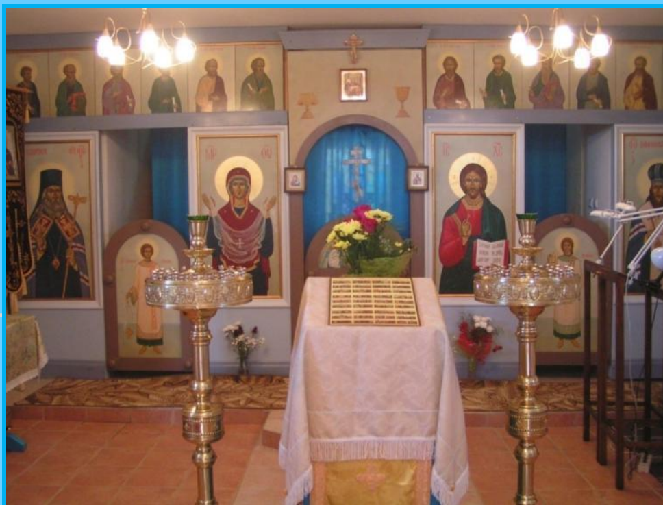
Внутреннее убранство храма Покрова Пресвятой Богородицы