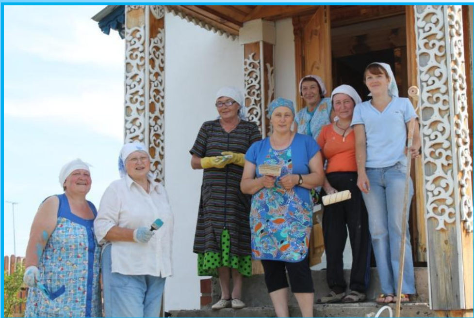
Ремонт храма, лето 2013 года