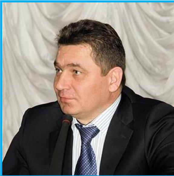
Валерий Геннадьевич Малеев