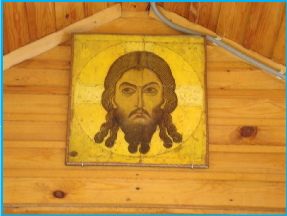
Икона над входом в храм