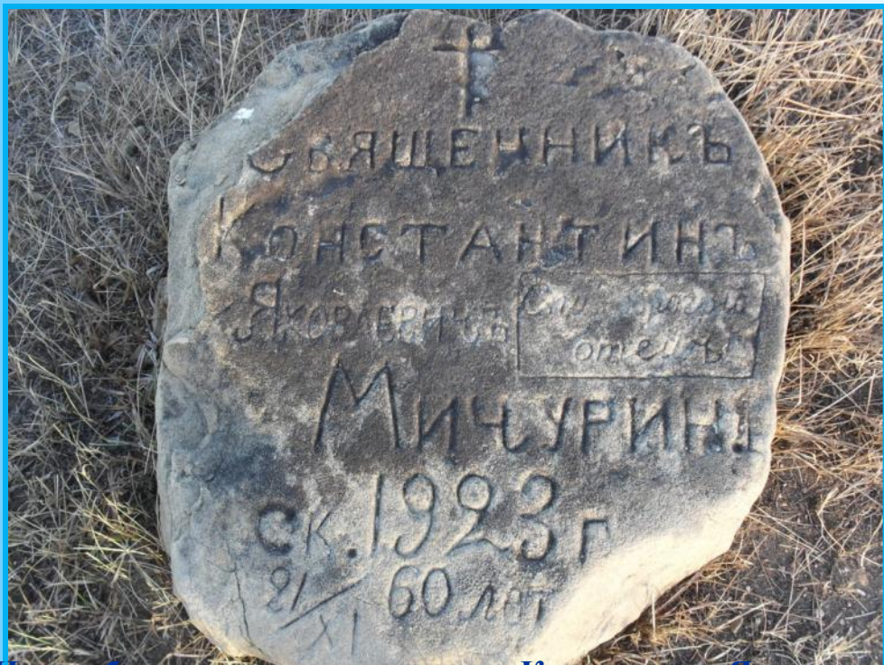
Надгробье на могиле священника Константина Яковлевича Мичурина