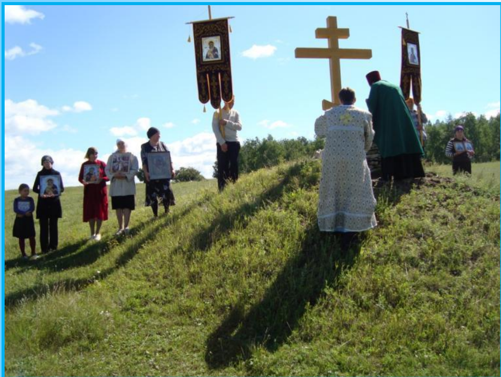
Установка поклонного креста на горе, над Каменкой