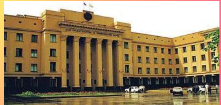
Чебоксары. Дом правительства