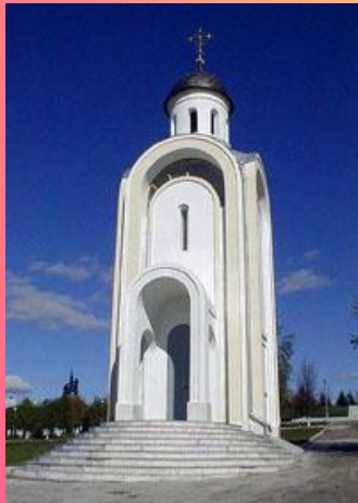
Часовня в парке Победы