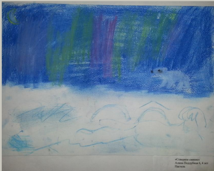
«Северный полюс» Подготовительная группа Работа кончиком пастели, штриховка, растушевка