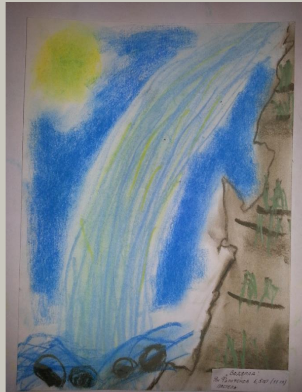
«Водопад» Подготовительная группа Работа кончиком пастели, штриховка, растушевка