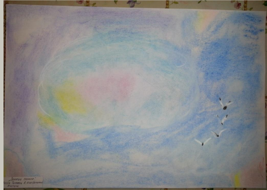
«Золотые облака» Подготовительная группа Работа кончиком пастели, растушевка