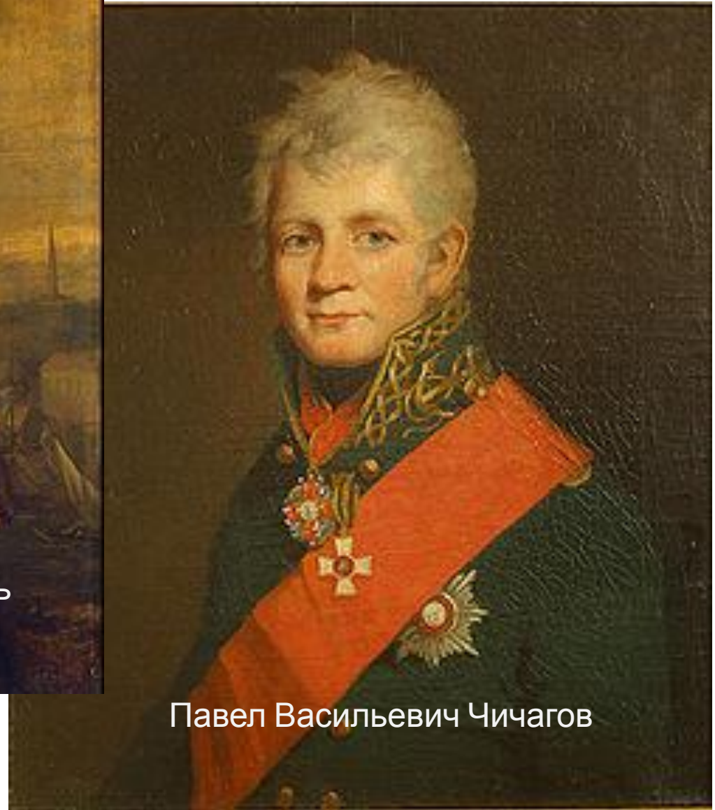
Павел Васильевич Чичагов