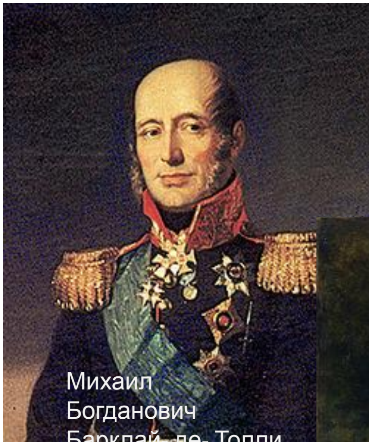
Михаил Богданович Барклай-де-Толли