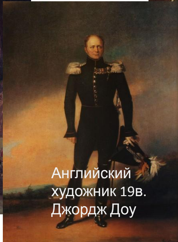
Английский художник 19в. Джордж Доу