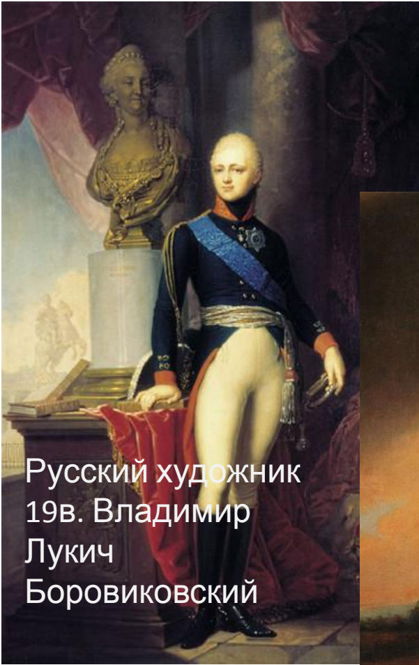
Русский художник 19в. Владимир Лукич Боровиковский