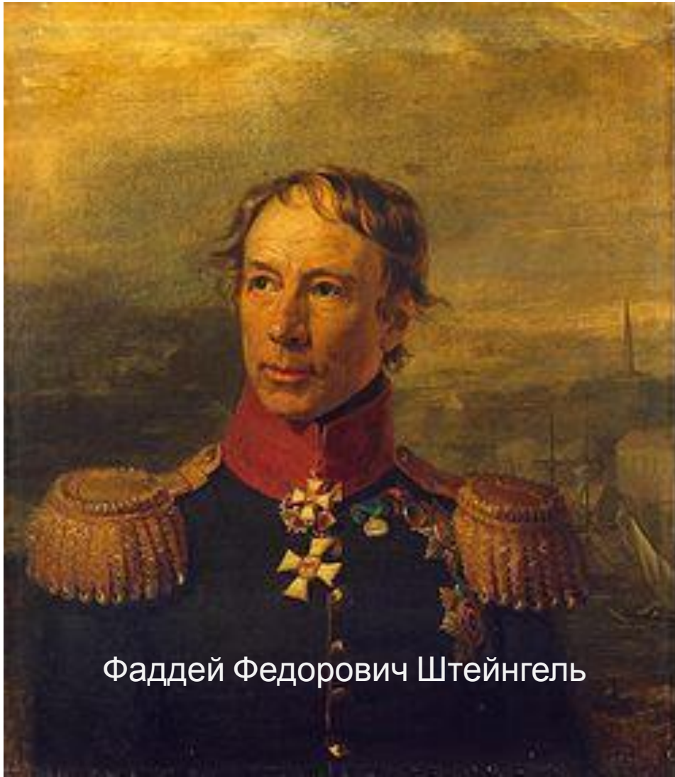
Фаддей Федорович Штейнгель