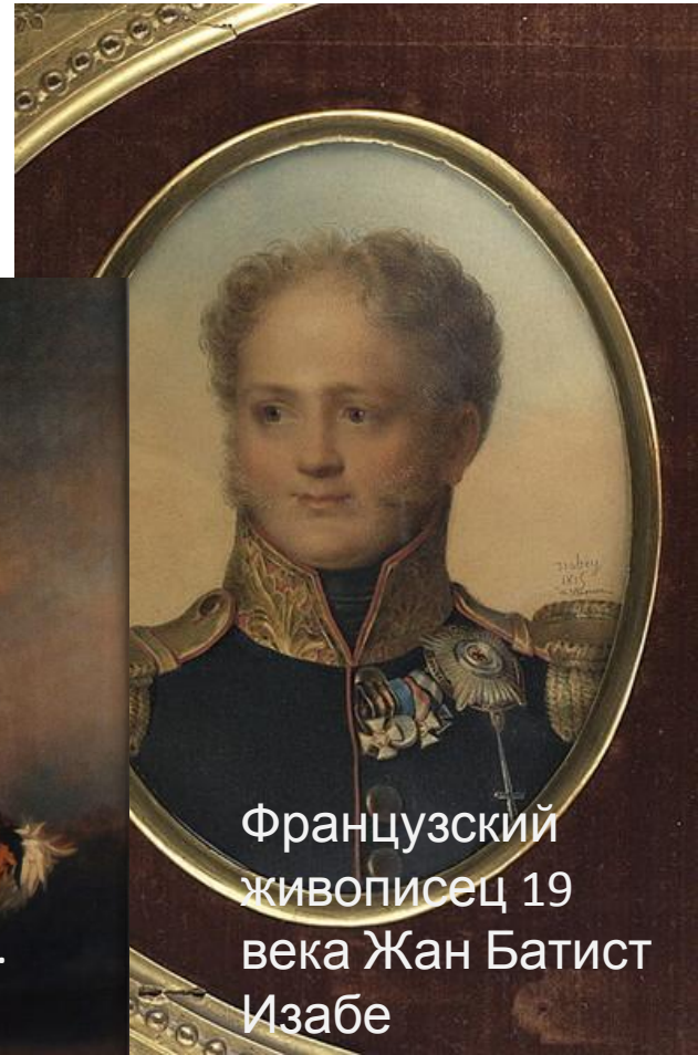
Французский живописец 19 века Жан Батист Изабе