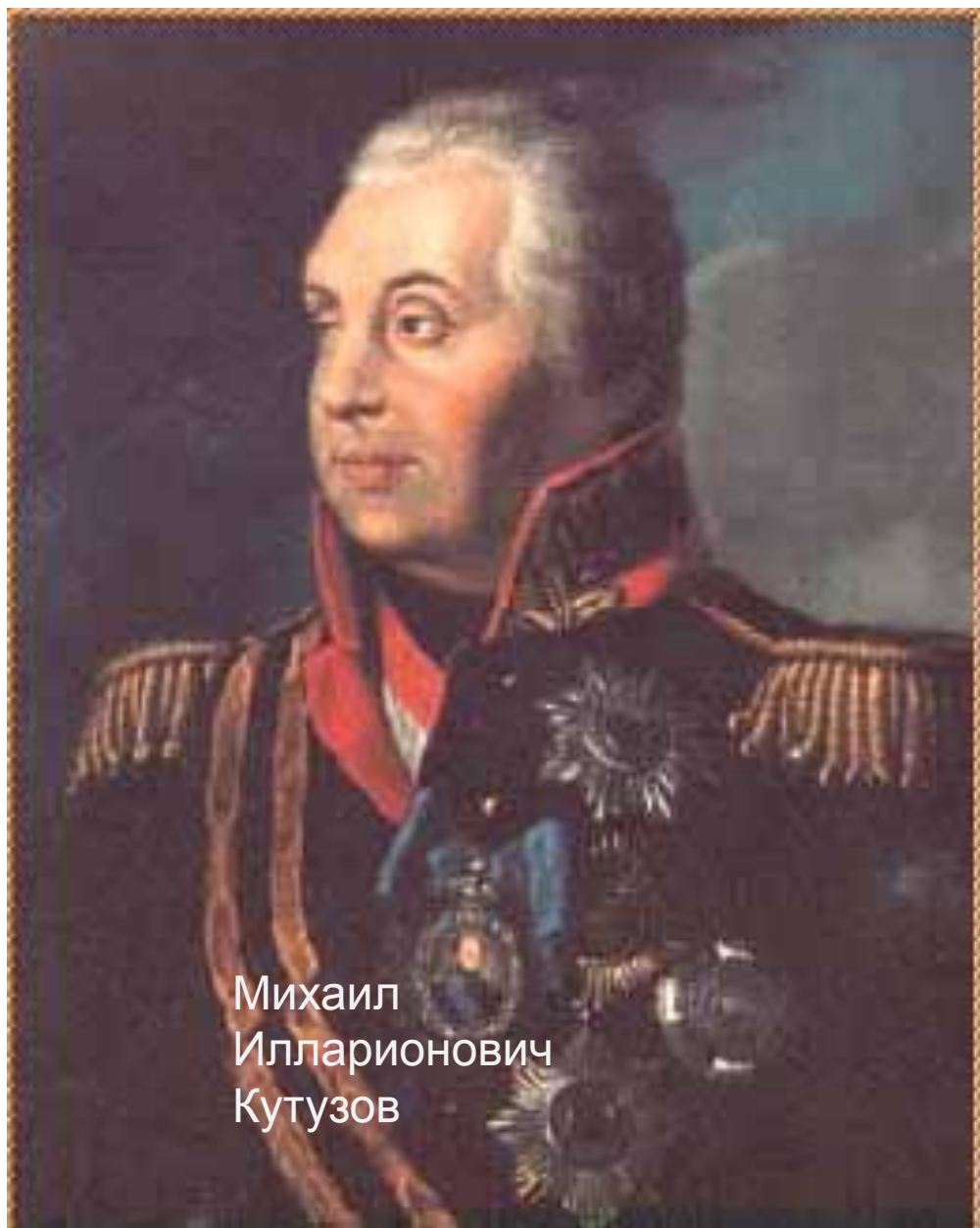
Михаил Илларионович Кутузов