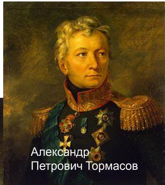
Александр Петрович Тормасов