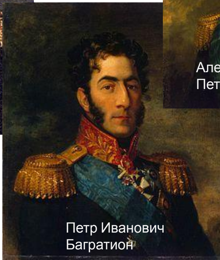
Петр Иванович Багратион