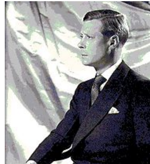
король Эдуард VIII