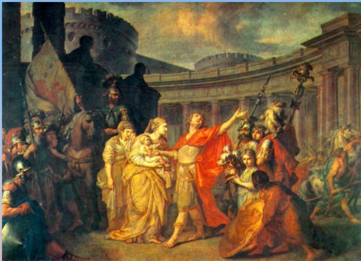
А.П.Лосенко «Прощание Гектора с Андромахой» 1773

В следующей картине на историческую тему А.П.Лосенко обратился к более традиционному для классицизма сюжету. На этот раз он избрал сцену из «Иллиады» Гомера, в которой можно было показать действительно героический момент – мужество уходящего для защиты родного города полководца и глубокое страдание остающихся.