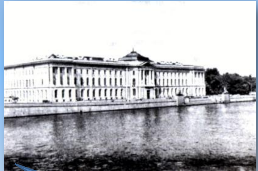
А.Кокоринов, Ж.Валлен-Деламот. Здание Академии художеств. 1758 год