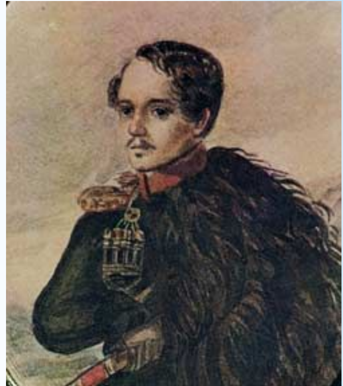
Автопортрет М. Ю. Лермонтова

* Прекрасные строки, посвященные М. Щербатовой, были положены на музыку композитором А.С. Доргомыжским . Романс “Отчего” быстро стал популярен.