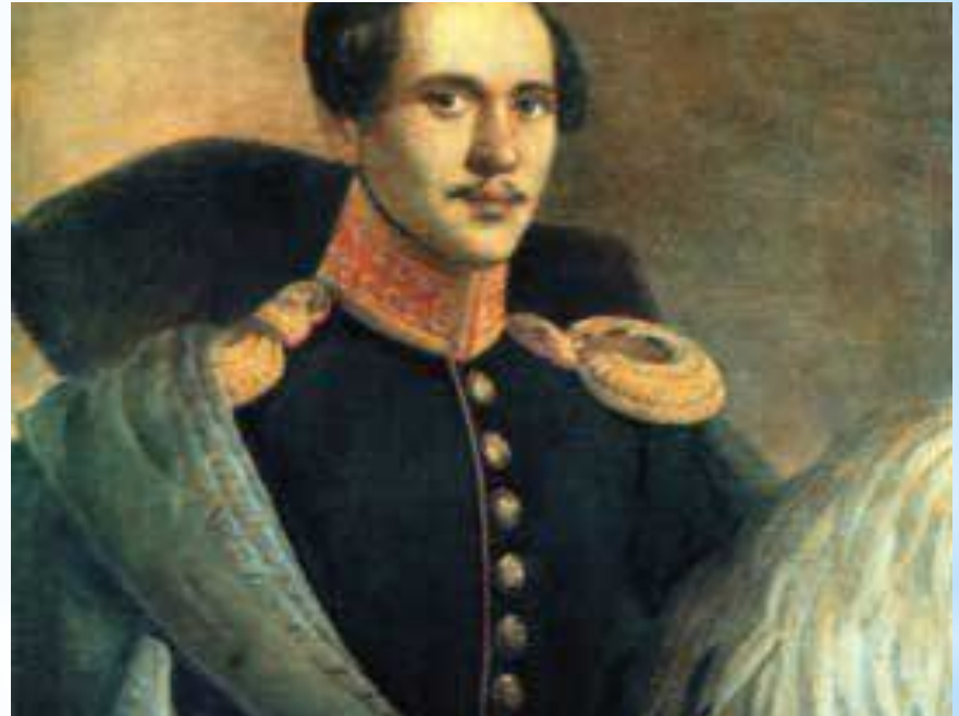
* Лермонтов в вицмундире лейб-гвардии Гусарского полка. 1834.

* Она не гордой красотою Прельщает юношей живых, Она не водит за собою Толпу вздыхателей немых. И стан ее не стан богини, И грудь волною не встает, И в ней никто своей святыни, Припав к земле, не признает. Однако все ее движенья, Улыбки, речи и черты Так полны жизни, вдохновенья. Так полны чудной простоты. Но голос душу проникает, Как вспоминанье лучших дней, И сердце любит и страдает, Почти стыдясь любви своей. (1832)