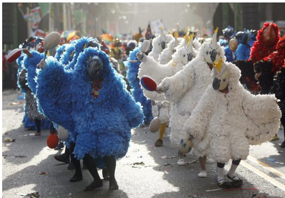
Карнавал в Доминикане

Однако карнавал не является исключительно венецианской или бразильской традицией. Подобные костюмированные действа происходят во многих странах мира. Карнавалы проводятся в Ницце на Лазурном берегу, в Кадисе на юге Испании, в Венгрии, на бургундских землях Нидерландов, Лимбурга и Северного Брабанта. А немцы готовятся к карнавалу со «звериной серьезностью»: в 11 часов 11-го дня 11-го месяца в Майнце, Дюссельдорфе, Кельне и Бонне создаются карнавальные комитеты.