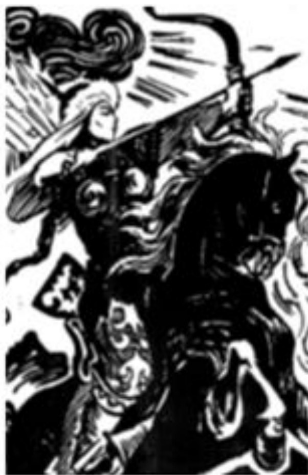
Иллюстрация к сказу «Зузелка»